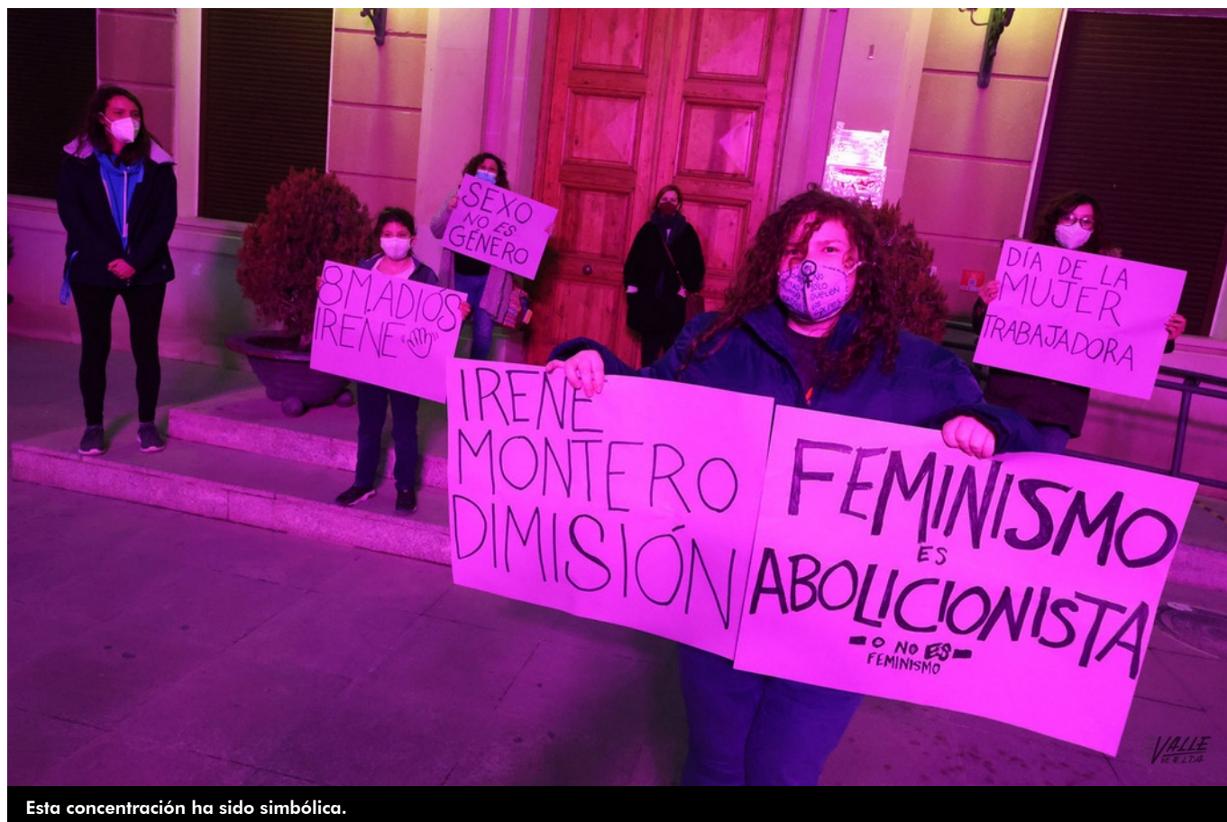
Esta concentración ha sido simbólica.

La población ha optado por no celebrar este 8M por motivos sanitarios, no obstante, los Ayuntamientos de Elda y Petrer conmemoran de forma sencilla el Día Internacional de la Mujer Trabajadora . El Consistorio eldense ha colgado una pancarta y el de Petrer ha optado por la lectura de un manifiesto para recalcar que las mujeres son esenciales. Sí ha habido una concentración simbólica y una cacerolada seguida por algunas personas.