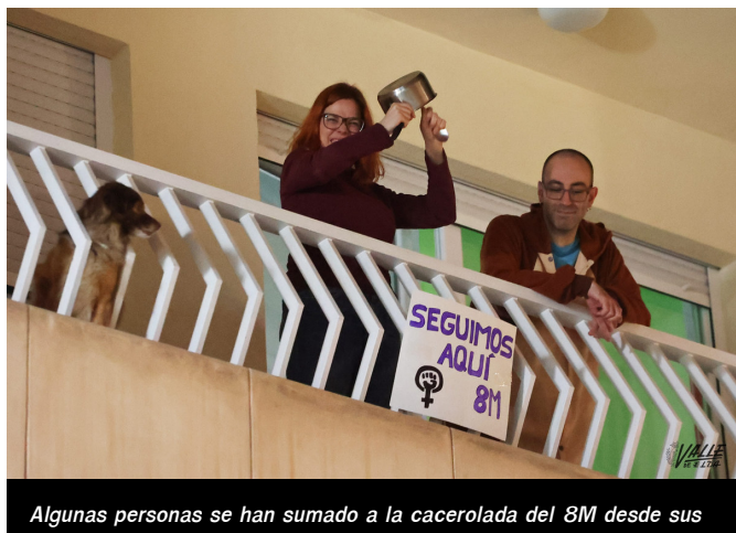
Algunas personas se han sumado a la cacerolada del 8M desde sus

A las 20 horas en algunas calles de Elda y Petrer se ha podido oír a personas sumándose a la cacerolada convocada por la Asamblea Feminista Vinalopó .