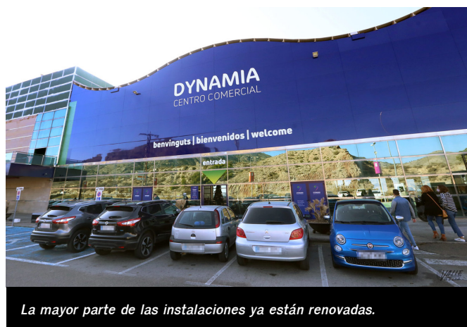
La mayor parte de las instalaciones ya están renovadas.

Ahora está en pleno proceso de renovación de la cartelería, si bien aún queda parte del trabajo por realizar, por lo que se espera que la reinauguración sea tras la Navidad.