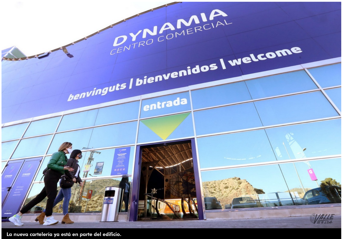
La nueva cartelería ya está en parte del edificio.

Dynamia es la nueva marca creada para la revitalización e impulso del antiguo Centro Comercial Bassa el Moro de Petrer , gestionado por Hipogés, plataforma de gestión de activos representante del fondo de inversión Gladyr Spain que adquirió dicho centro el pasado mes de agosto. El objetivo es que Dynamia se convierta en un punto de referencia con la apertura de nuevos comercios que lo doten de una renovada oferta comercial y de ocio, complementaria a la existente en la zona.