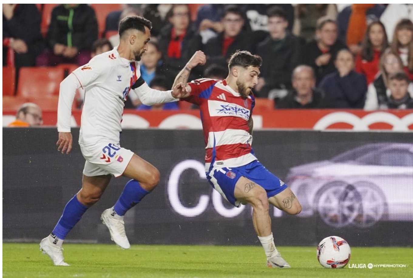
El Eldense no ha podido con el Granada que jugaba en casa | LaLiga.

El Eldense ha dejado de sumar un punto en el minuto 89 al confiarse y dejar que el Granada recuperase la posesión del balón en su casa. El conjunto nazarí ha marcado dos goles en la primera parte gracias a Uzuni y Boyé, pero el Eldense ha igualado el marcador al inicio de la segunda mitad con goles de Chapela y Juanto. El Eldense suma seis jornadas sin conseguir la victoria y se encuentra en puestos de descenso con 12 puntos y un partido menos.