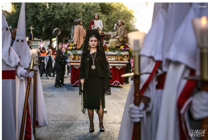
Las manolas están presentes en cada procesión.