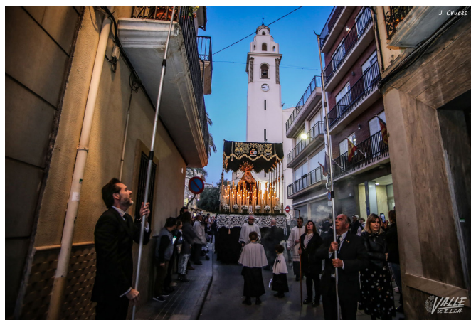
La Soledad a su paso por la angosta calle La Iglesia.

Por segundo año consecutivo, las imágenes de Jesús de Medinaceli y el Nazareno llegaron hasta las puertas del templo de Santa Ana minutos antes de las 19:30 horas, portadas desde su sede, ya que no han permanecido en el templo esta semana. Asimismo este año tampoco ha participado en el Santo Entierro la imagen de San Juan y Las Tres Marías debido a la escasez de costaleros de su cofradía, la del Santo Sepulcro .