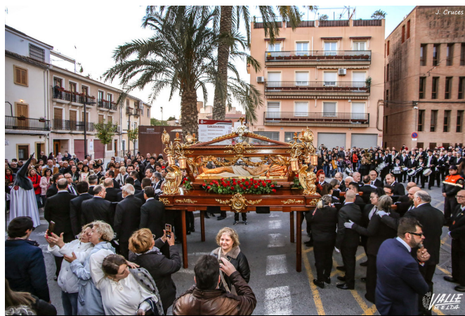
El Cristo Yacente ha procesionado acompañado por todas las cofradías.

Mañana, Domingo de Resurrección, se pondrá el punto final a una intensa semana de procesiones con el Encuentro de Gloria con el Santísimo Bajo Palio y la Inmaculada Concepción. Este será a las 11 horas en la Plaza Castelar. Una hora antes saldrá el Santísimo desde Santa Ana y la Inmaculada desde su parroquia lo hará a las 10:30 horas.