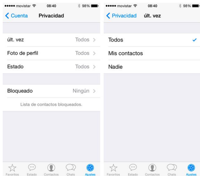
En la imagen: Ajustes de privacidad en iPhone.

Una vez estamos en las opciones de privacidad, la pantalla se divide en dos grupos: Quién puede ver mi información personal y Mensajería.