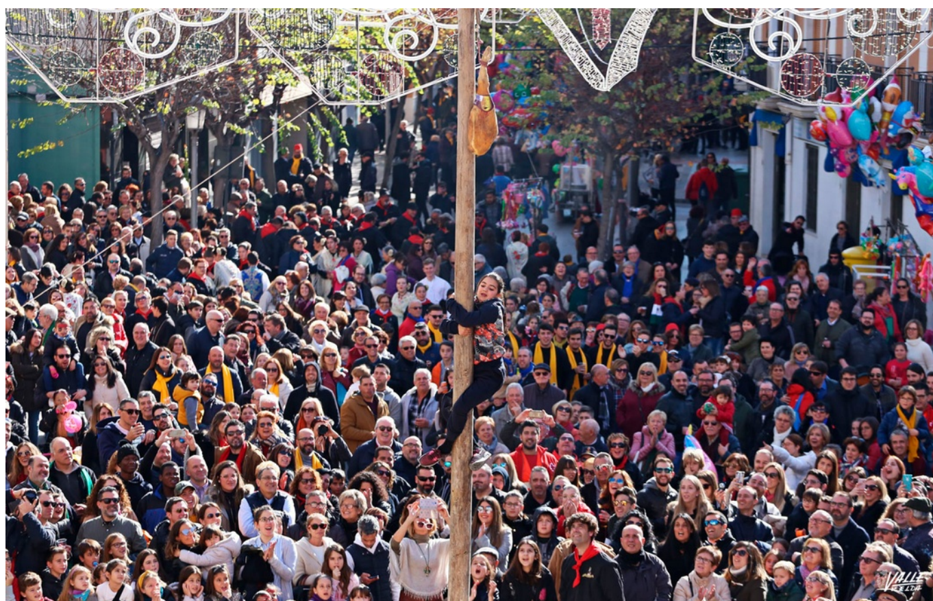
La Plaza de la Constitución y parte de Colón se han llenado de gente

Los eldenses han vuelto a llenar esta mañana la Plaza de la Constitución y parte de la calle Colón para cumplir con una costumbre muy arraigada. Cada sábado de la Media Fiesta los festeros , ya con la bufanda de su comparsa al cuello para protegerse del frío, disfrutan de la cucañas, porrate y danzas en honor a San Antón , patrón de los Moros y Cristianos. El sol ha calentado a los eldenses en una fresca mañana en la que se han registrado unos 12 grados.