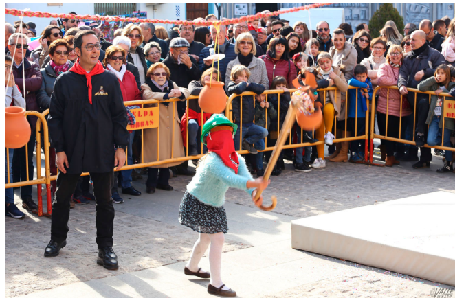
Los pequeños han disfrutado de los juegos tradicionales | Jesús Cruces.

Esta tarde continúan los actos a partir de las 17 horas, momento en el que llegarán los cargos a la Junta Central. A las 17:45 horas será la salida del Estandarte de San Antón con salva de arcabucería , desde la Casa de la Viuda de Rosas partirán hasta la ermita del patrón de los Moros y Cristianos. A las 18:30 horas, ya a las puertas de la ermita se disparará un nueva salva de arcabucería . A las 19 horas arrancará el traslado del Santo hacia Santa Ana con el siguiente recorrido: Novo Hamburgo, Independencia, Andrés Amado, Espoz y Mina, Plaza Constitución, Colón, Nueva, Ortega y Gasset, Jardines, Juan Carlos I, Antonino Vera, Pedrito Rico, San Francisco, iglesia de Santa Ana.