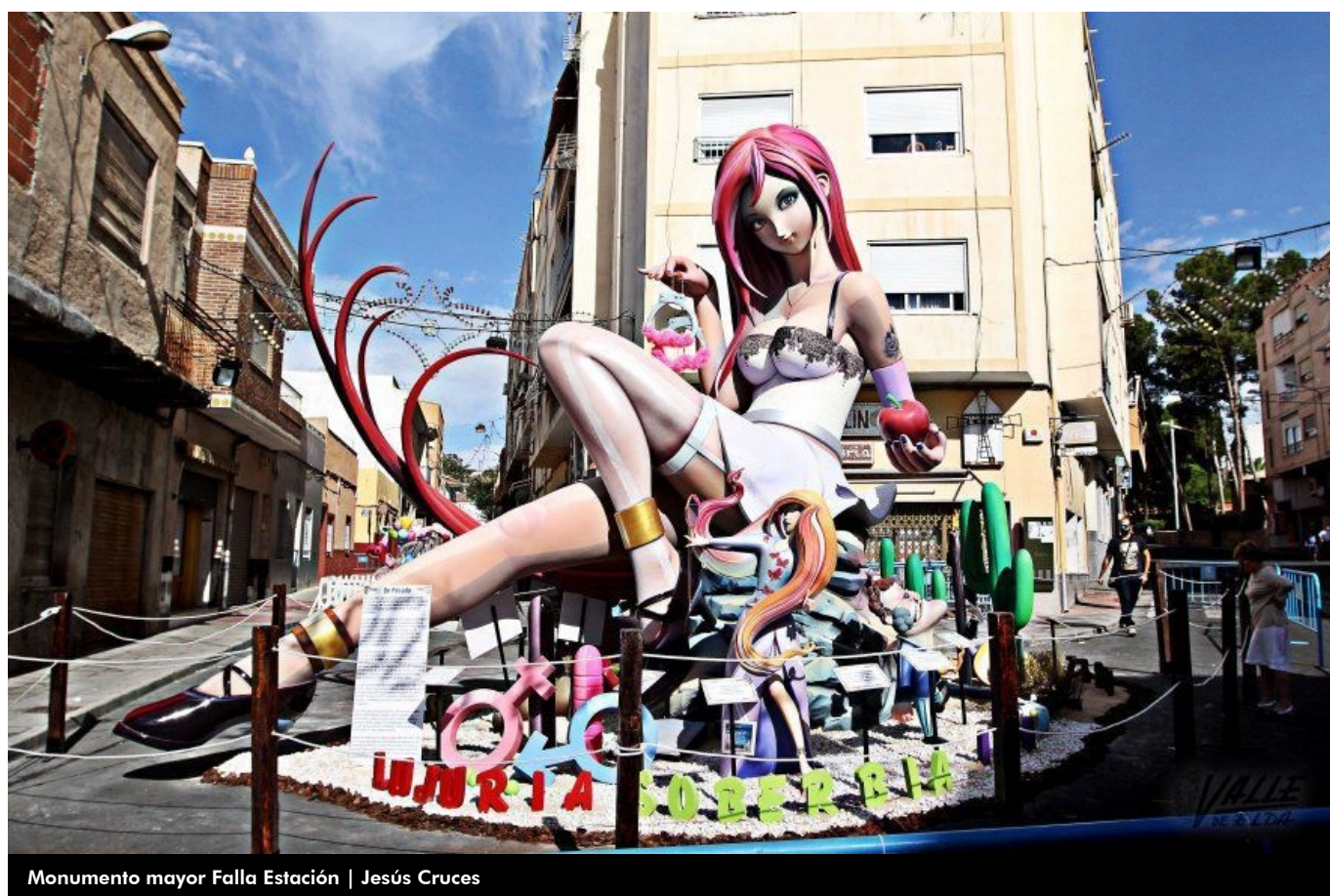
Monumento mayor Falla Estación | Jesús Cruces

Elda ha amanecido esta mañana entre monumentos, y es que tras una noche de esfuerzo, las 17 fallas lucen desde primera hora del día imponentes y repletas de colorido. Durante el fin de semana se espera que miles de personas acudan a los diferentes barrios de la ciudad para ver sus monumentos. Este año los temas que más han recogido las fallas son la política local, pero también la nacional e internacional, el sexo y la fantasía.