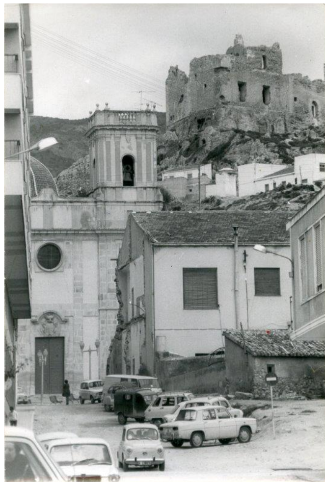
Enderrocament d'una casa i part de l'Ajuntament per a obrir el carrer Constitució. Fins a este moment, només es podia accedir a la plaça pel carrer Miguel Amat i pels dos laterals de l'església, ja que encara no existia connexió amb la plaça de Dalt. Any 1972.

o Ajuntament va patir un desgraciat canvi i es va transformar en un modern edifici que trenca l'aspecte del conjunt, igual que la Casa del Fester. En definitiva, es necessita conservar el sabor tradicional del barri antic, però dotant-lo d'unes infraestructures adequades i modernes.