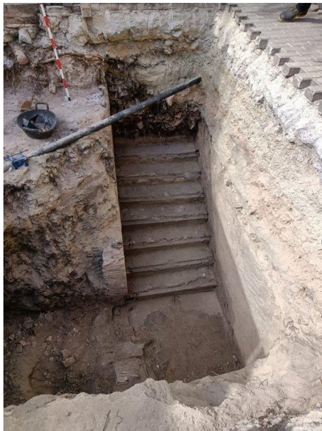
Accés al refugi pròxim a l'escalinata de l'església de Sant Bertomeu.