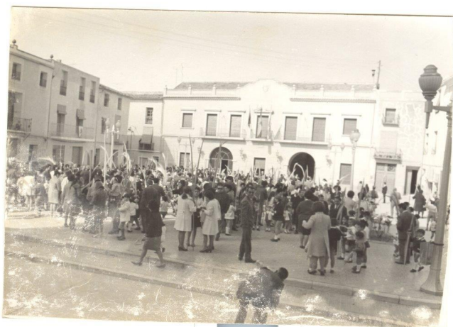
Un Diumenge de Rams a la plaça de Baix | José Esteve.

En este singular enclavament va estar també el beateri, que era un centre escolar eclesiàstic on es preparava a una minoria de jòvens per a seguir la carrera eclesiàstica o cursar estudis superiors, que va ser desmantellat i venut amb la desamortització de Mendizábal en 1837; així com l'administració de correus i la Caixa Postal d'Estalvis, en els anys vint del passat segle, fins que es van traslladar al carrer Pedro Requena.