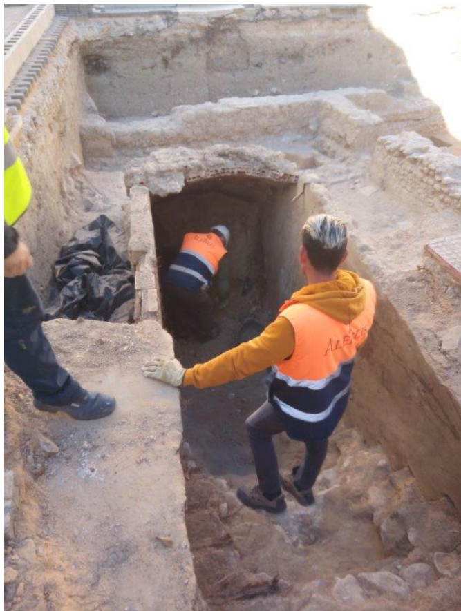
Procés d'excavació de l'entrada del refugi pròxima a l'edifici de l'Ajuntament.