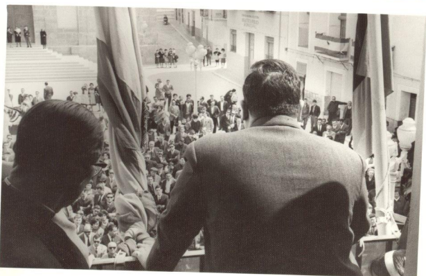
La plaça de Baix vista des de l'ajuntament. 1 d'abril de 1964 | Navarro.

Una actuació determinant respecte a esta plaça va resultar ser la que es va produir l'any 1968 en derrocar-se la vivenda adjacent a l'Ajuntament, que va servir d'obertura del carrer Constitució (aleshores 18 de Julio), ja que no sols va modificar l'espai de la plaça de Baix, sinó que també va reorganitzar l'antiga zona d'horta a l'esquena d'esta, on anys més tard, en 1975, es trobaria el mosaic romà.