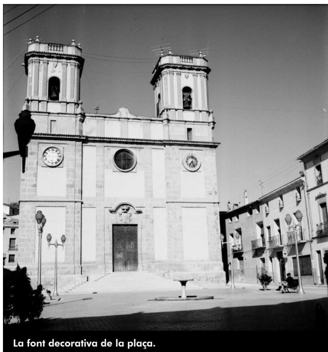
La font decorativa de la plaça.

En 1819 se la coneix com a plaça Major. En 1836 i, entre els actes celebrats amb motiu de la promulgació de la Constitució de 1812, que es va jurar a Petrer en la missa conventual, es va manar construir una làpida amb la inscripció de "plaza de la Constitución, proclamada en Cádiz el año 1812". En 1914 es van plantar arbres i en 1930 encara se la coneixia com a plaça de la Constitució.