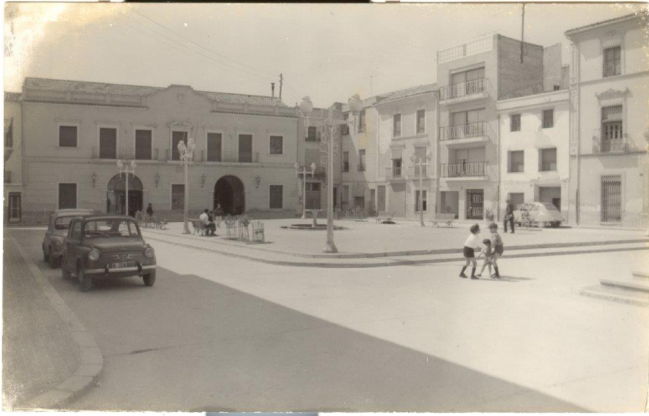
La plaça de Baix, al fons, l'ajuntament | José Esteve.

La vida en este lloc es remunta a època romana, denominada Vila Petraria, perquè són nombrosos les restes mobles i immobles que ens parlen de la seua importància. D'igual manera, altres restes trobades en la plaça testimonien l'existència una ocupació d'època musulmana, el nostre Bitrir, concretament del període califal, al voltant del segle X.