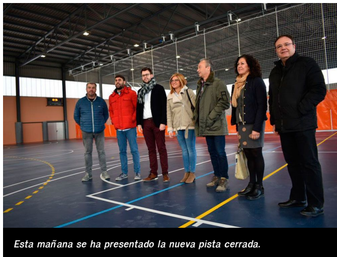
Esta mañana se ha presentado la nueva pista cerrada.

En cuanto a la parte técnica, el arquitecto municipal ha informado que el mayor problema que ha tenido este