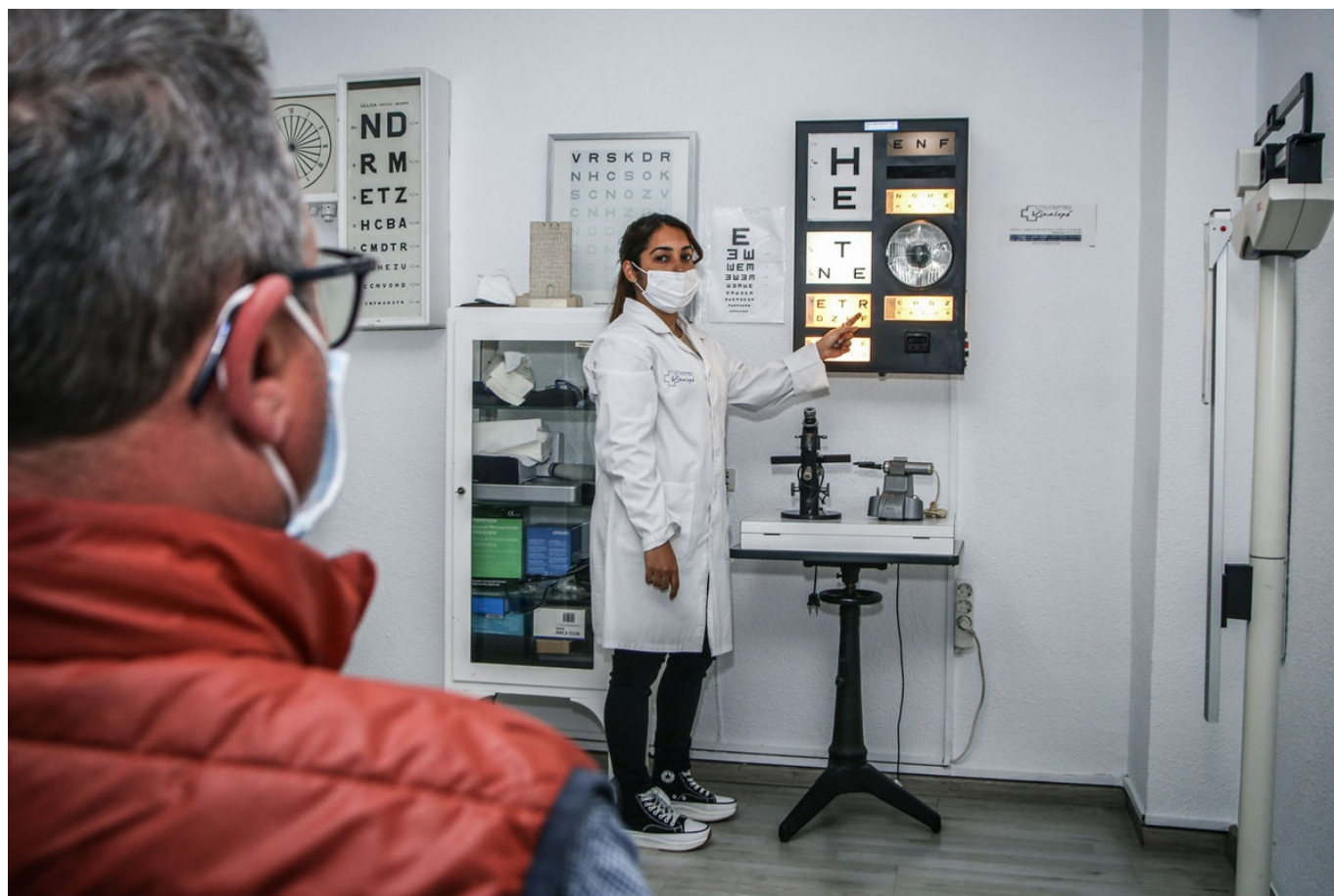
El centro se encarga de renovar tu permiso de conducir y de armas.

Centro Médico Vinalopó se encarga de renovar tu permiso de conducir y de armas desde hace más de 35 años. Pero no solo eso, ya que, llevan a cabo con profesionalidad todo tipo de reconocimientos médicos y test psicotécnicos para vigilante de seguridad, oposiciones a Bombero, Policía, Magisterio, Patrón de embarcaciones de recreo, para posesión de perros peligrosos, para clubes deportivos, reconocimientos médicos oficiales y mucho más, en Elda, Petrer y comarca.