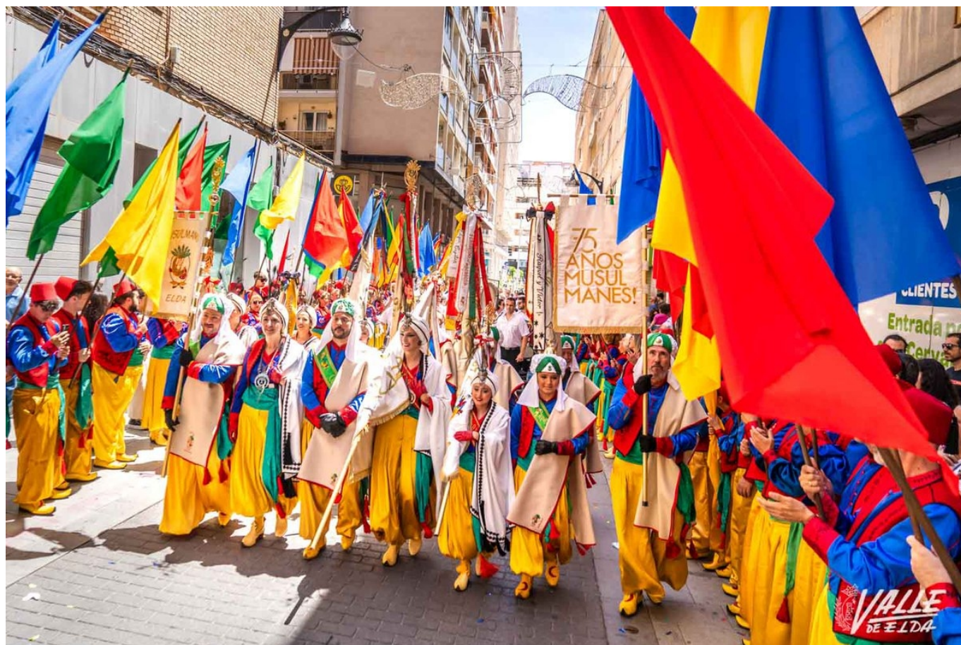
La comparsa ha desfilado con orgullo | Nando Verdú.

Elda ha vuelto a responder a la llamada de la fiesta. La comparsa Moros Musulmanes ha celebrado hoy su desfile extraordinario del 75 aniversario . Cientos de voces han entonado Elda musulmana , ya que festeros y público se han unido para cantar esta marcha mora que ha calado en toda la ciudad desde que se compuso en 1950.