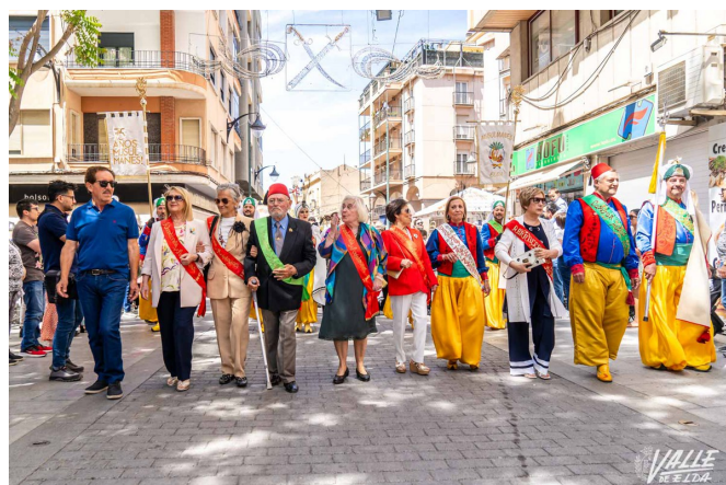
Antiguas capitanías han desfilado hoy

La jornada ha comenzado pasado el mediodía con un pasacalles desde las puertas del Casino Eldense hasta la Plaza Castelar. En el mismo han participado las capitanías de estos 75 años acompañadas por la AMCE Santa Cecilia.