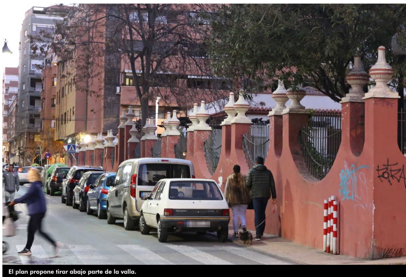
El plan propone tirar abajo parte de la valla.

El Jardín de la Música lleva años abandonado a su suerte . Desde hace aproximadamente una década este parque ha sufrido un deterioro que no se ha frenado y los vecinos no lo visitan porque afirman que "se ha convertido en un pipicán" . Ahora el Ayuntamiento de Elda, a través del organismo autónomo IDELSA, ha presentado un Plan Director para su rehabilitación que propone acabar con la imagen de este emblemático punto tal y como se conoce, pues apuesta por derribar parte del muro perimetral, así como colocar juegos infantiles y reabrir el quiosco . Es una propuesta del arquitecto local Manuel Mateo a petición del Consistorio.