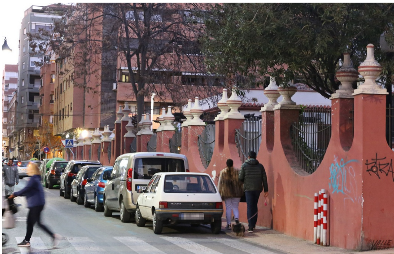
El plan propone tirar abajo parte de la valla.