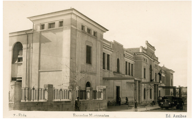
7 - Rda