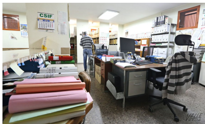
El mobiliario se ha ido reemplazando durante 38 años con muebles desechados por otros juzgados | Jesús Cruces.

Este sindicato tiene claro que “esta situación lamentable viene producida por simple dejadez y una desastrosa organización . Parece que no interesa que en este país la justicia funcione , nos hacen trabajar de forma lenta y sin los medios correctos, eso ralentiza toda la justicia” .