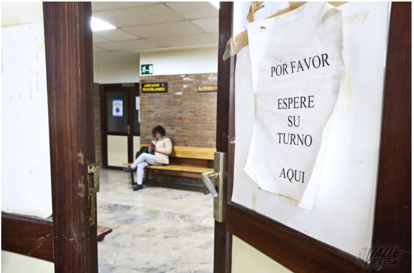
Las puertas y ventanas no se han renovado desde 1981 | Jesús Cruces.

La Central Sindical Independiente y de Funcionarios, CSIF , denuncia la "dejadez" que sufre el edificio de los Juzgados de Elda , en el que a diario trabajan en torno a 70 personas y que visitan otras tantas . El inmueble es uno de los primeros juzgados de la Comunidad Valenciana, se construyó en 1981 , hace casi 40 años, y desde entonces no se ha sometido a mejora alguna. El sindicato lamenta que "los trabajadores llevan más de tres años esperando una reforma integral que no llega. Parece un edificio perdido en el tiempo , los baños están obsoletos -hay uno clausurado porque se han caído los azulejos-, las cañerías están corroídas, los