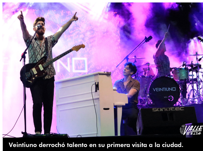
Veintiuno derrochó talento en su primera visita a la ciudad.