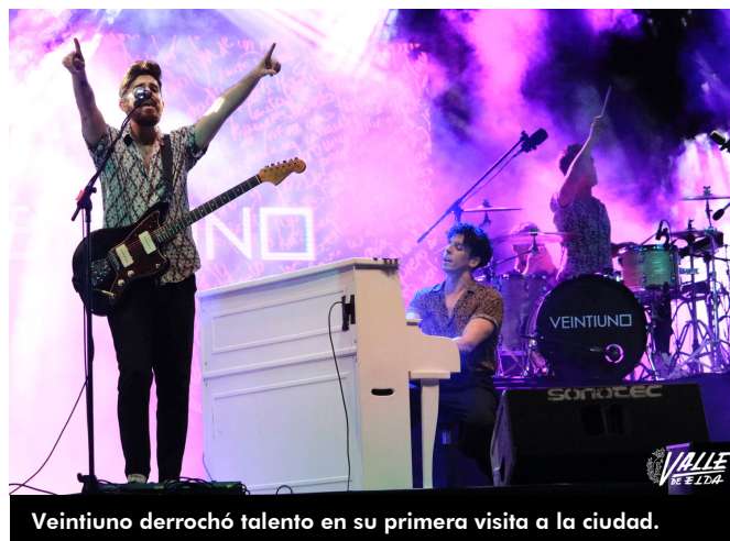
Veintiuno derrochó talento en su primera visita a la ciudad.