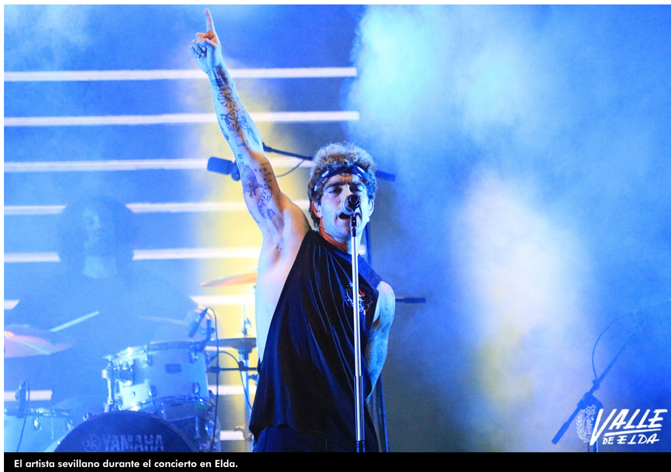
El artista sevillano durante el concierto en Elda.

Los eldenses recibieron con ganas al cantante Álvaro de Luna , que anoche derrochó simpatía y talento a partes iguales durante la segunda noche de conciertos organizada por el Ayuntamiento para celebrar las Fiestas Mayores. El joven artista actuó durante cerca de una hora y media y animó a los presentes a disfrutar al máximo. Durante su última canción, Juramento eterno de sal , se quitó la camisa, se internó entre el público, en su mayoría jóvenes, que lo recibieron con ganas y vitorearon a de Luna, uno de los artistas emergentes del país que más suenan en la radio.