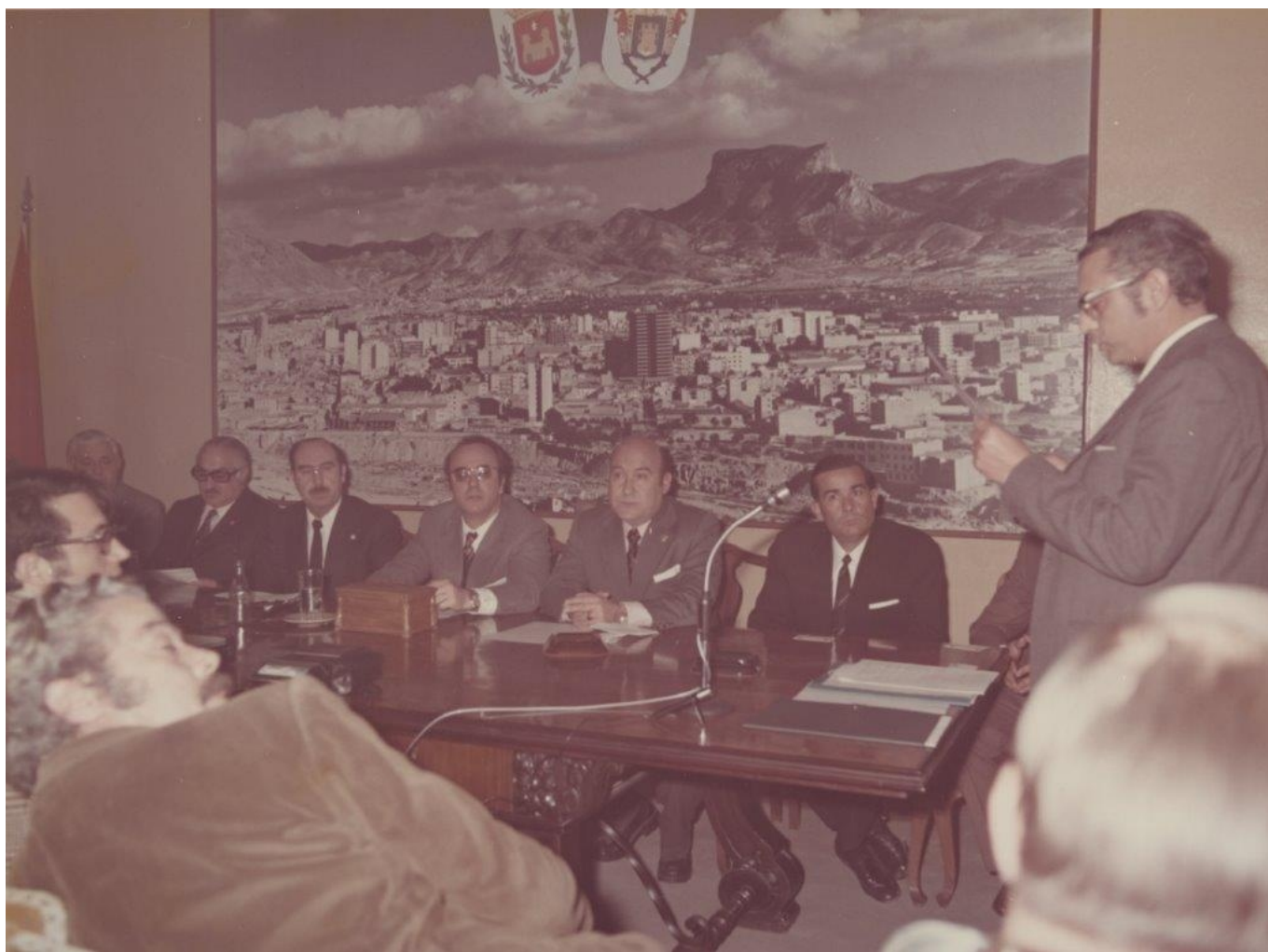
Acto de constitución de la Mancomunidad Intermunicipal Elda-Petrer. 27-I-1973.

El sábado 27 de enero de 1973 se constituyó la Mancomunidad Intermunicipal de Elda-Petrer que pretendía ofrecer una cobertura más amplia en la mejora de los servicios, las relaciones y la calidad de vida de los habitantes de ambos municipios, con proyectos de carácter global donde estuviesen implicados Petrer y Elda. Se suponía que así quedaban atrás rencillas seculares y enfrentamientos entre ambos pueblos aunque, no era así del todo, ya que estaban muy recientes episodios tan tristes como la decisión del Ayuntamiento de Elda de convocar un pleno