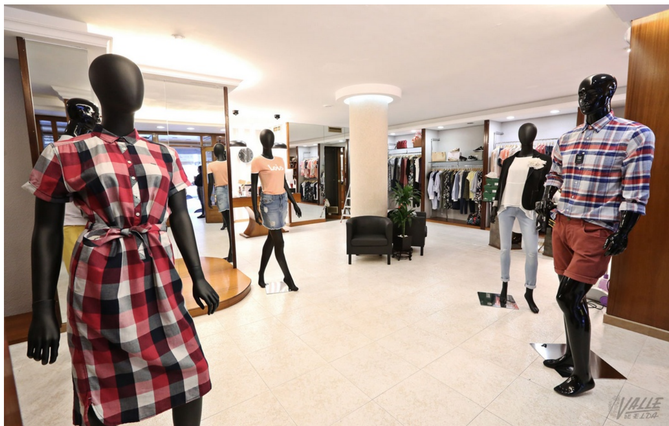
Imagen del interior de la tienda que abre mañana | Jesús Cruces.

La tienda de ropa Glamour Outlet abre mañana sus puertas en Elda con las mejores marcas al mejor precio . La inauguración tendrá lugar mañana 6 de abril a las 18 horas y a todos los clientes se les realizará un descuento de 5 euros para celebrar su apertura. Glamour Outlet tiene primeras marcas como Pepe Jeans, Hugo Boss, Lacoste, Calvin Klein, Armani Jeans, Tommy Hilfiger o Lois entre muchas otras.