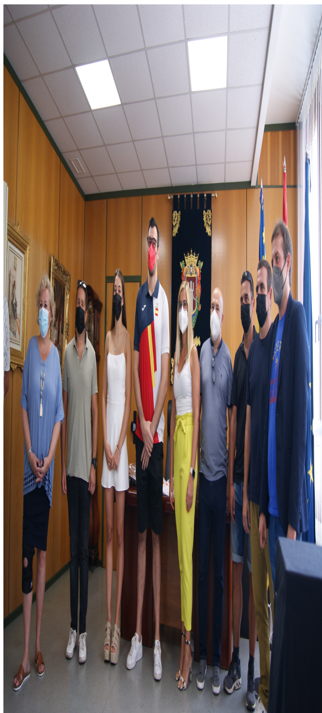
Alcaldesa y el cuerpo municipal del Ayuntamiento de Petrer junto a los olímpicos