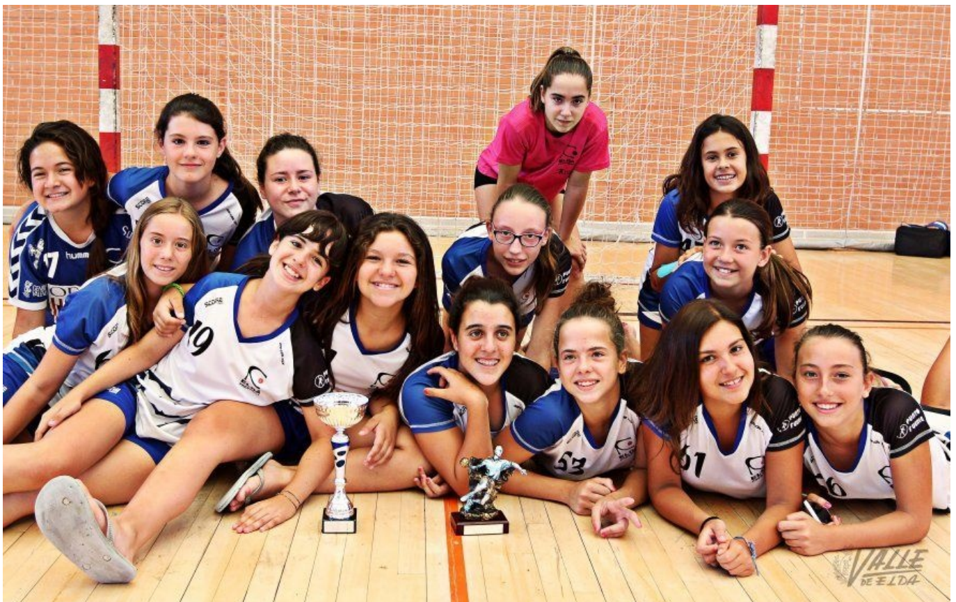
Los equipos posaron con sus trofeos en el Polideportivo Ciudad de Elda