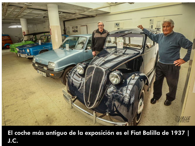
El coche más antiguo de la exposición es el Fiat Balilla de 1937 | J.C.

Algunos de los vehículos que más destacan son el Fiat 508 Balilla del 1937 , que es el más antiguo de la exposición, y que además puede alcanzar los 85 km/h. En el apartado de las dos ruedas ha resaltado la Cofersa