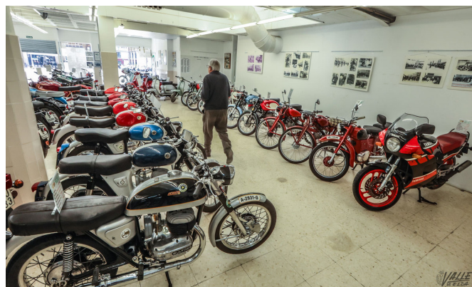
La Asociación Cultural Amigos Motos y Coches Antiguos Elda organiza esta exposición

125cc de 1957 o una BMW de 1960. “Todos los coches y motos que tenemos en la exposición pertenecen a los socios de la Asociación, y cada año vamos cambiando para que no sean siempre las mismas”, ha indicado Martínez.