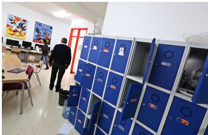
Durante el robo se forzaron las taquillas de los profesores