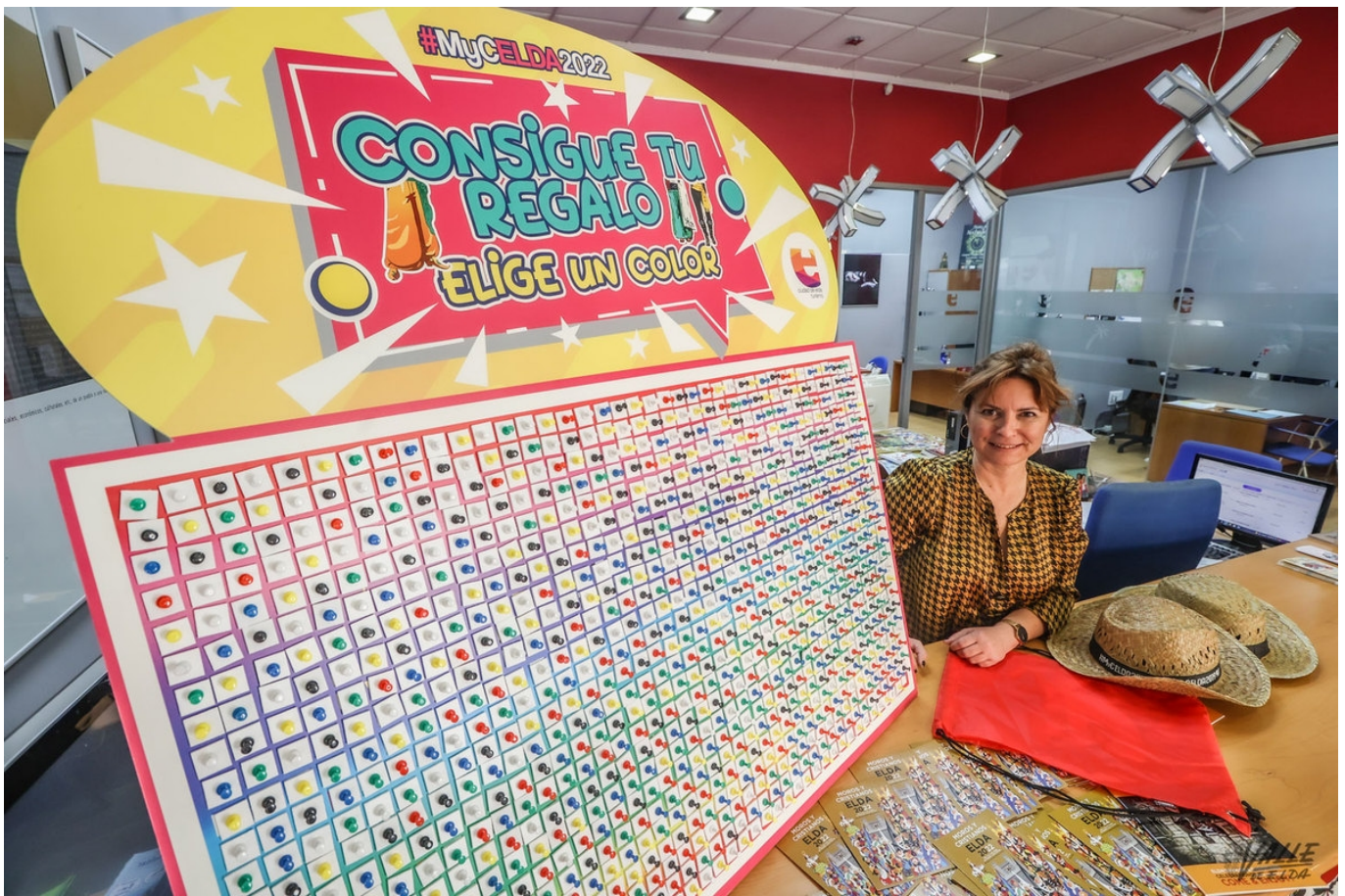
El panel se situarán en la Tourist Info.