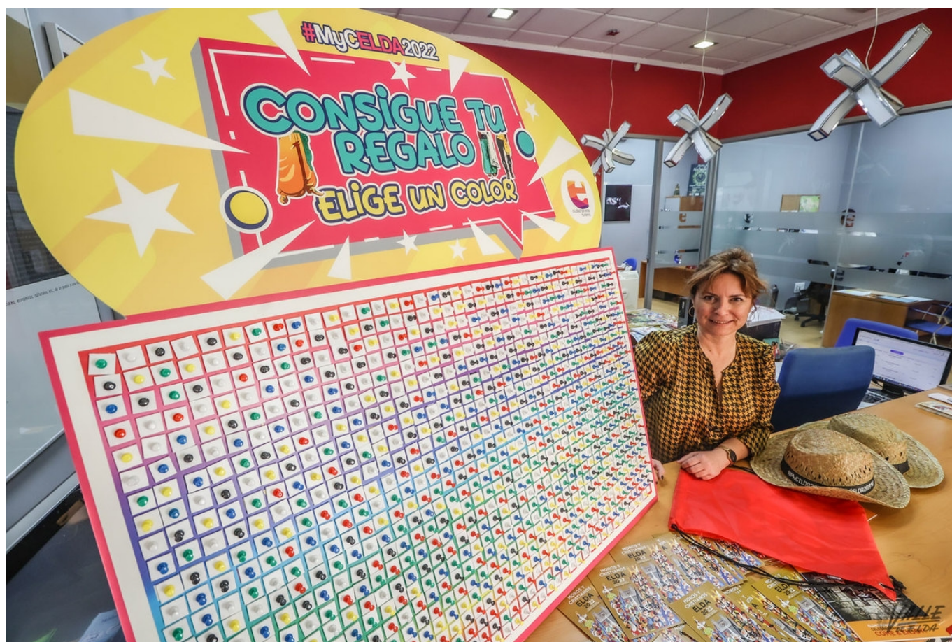
El panel se situarán en la Tourist Info.