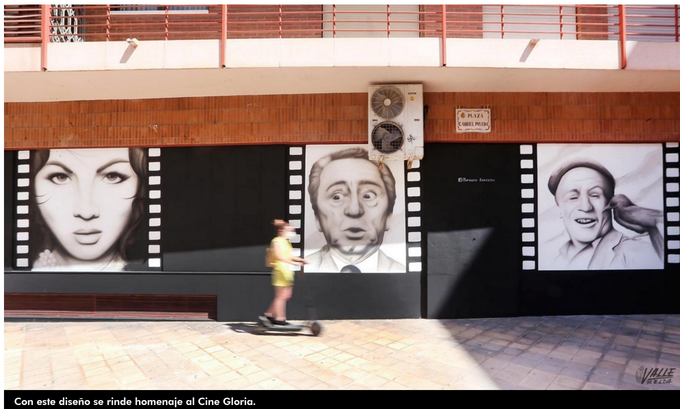
Con este diseño se rinde homenaje al Cine Gloria.

La historia de Elda y algunos de sus más emblemáticos establecimientos de hace solo unas décadas se escurren entre los dedos del olvido , prueba de ello es que las nuevas generaciones no han oído hablar de ellas. Un buen ejemplo es el cine Gloria, que estaba ubicado en la actual Plaza Gabriel Poveda de 1963 a 1986. Hoy ha abierto un estanco con su nombre donde estaba esta sala de cine, y cuya fachada sus propietarios han decorado con dibujos de rostros de actores españoles.