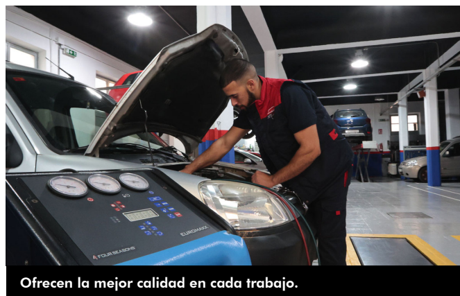
Ofrecen la mejor calidad en cada trabajo.

Limpiar el vehículo es laborioso y complicado y con el fin de ayudar a sus clientes, ofrecen el servicio de limpieza del coche profundo, de hecho, queda como salido de la casa, con este fin cuenta también con una máquina para limpiar las tapicerías. El precio va desde los 15 euros hasta los 49 euros, una oferta que se adapta a todos los bolsillos y necesidades.