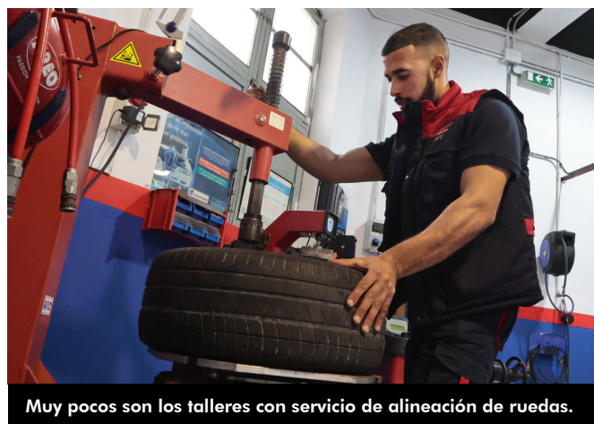
Muy pocos son los talleres con servicio de alineación de ruedas.

Los clientes de Autotaller HB pueden solicitar cita previa sin esperas. El horario es de lunes a viernes de 8:30 a 13:30 horas y de 16 a 20 horas; y los sábados de 9 a 13:30 horas. Pueden llamar a los teléfonos 965 39 11 28 y 688 796 978.