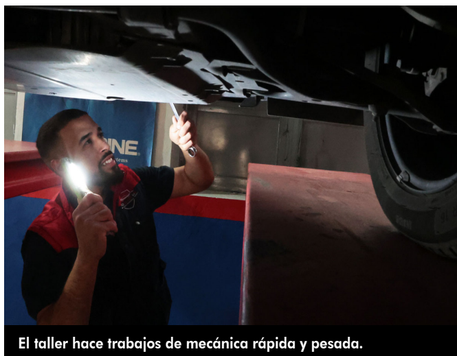
El taller hace trabajos de mecánica rápida y pesada.

Hacen trabajos tanto de mecánica pesada como rápida, en el primer caso realizan desde el cambio de la junta de culata hasta de la caja de cambios pasando por la correa de distribución o el cambio o reparación de turbos; en el segundo caso, hacen cambio de aceite, filtros, revisión de suspensiones, frenos y mucho más. También rellenan el aire acondicionado del vehículo, esencial ahora que se acerca el verano y las temperaturas comienzan a subir.