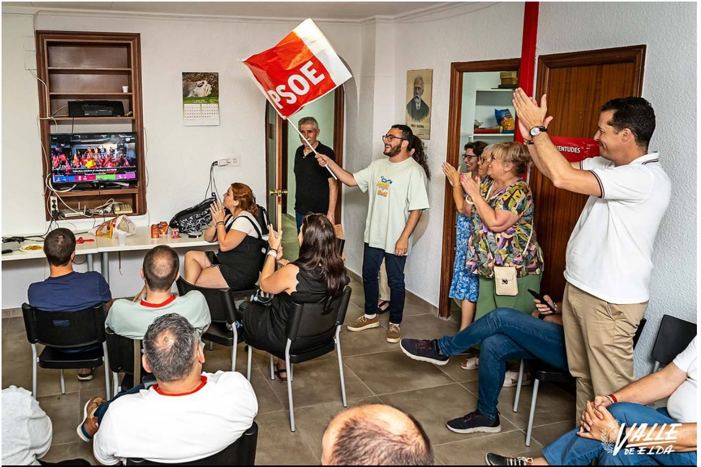
Los socialistas han celebrado el resultado en Elda | Nando Verdú.

El Partido Socialista vuelve a ser el partido más votado en las elecciones nacionales al Congreso en Elda al sumar el 37,37 por ciento de los votos. El partido que más ha crecido ha sido el PP , pues ha aumentado en cerca de 12 puntos al registrar el 34,06% de los apoyos. Vox vuelve a ser la tercera fuerza con el 15,11 por ciento de los votos y Sumar la cuarta con 11,19 por ciento de los apoyos. La participación ha subido ligeramente en estas elecciones hasta el 71,44 por ciento, y muy pocos votos han sido nulos o blancos.