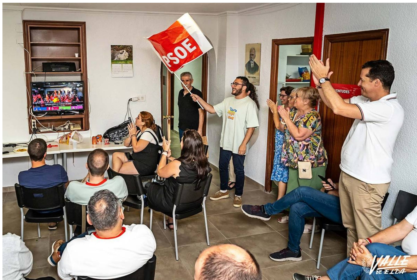
Los socialistas han celebrado el resultado en Elda | Nando Verdú.

El Partido Socialista vuelve a ser el partido más votado en las elecciones nacionales al Congreso en Elda al sumar el 37,37 por ciento de los votos. El partido que más ha crecido ha sido el PP , pues ha aumentado en cerca de 12 puntos al registrar el 34,06% de los apoyos. Vox vuelve a ser la tercera fuerza con el 15,11 por ciento de los votos y Sumar la cuarta con 11,19 por ciento de los apoyos. La participación ha subido ligeramente en estas elecciones hasta el 71,44 por ciento, y muy pocos votos han sido nulos o blancos.