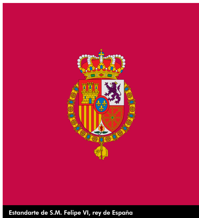
Estandarte de S.M. Felipe VI, rey de España

".... pague a Nicolau Rodenes per una vara de tafetà encarnat pera una bandera para la companyia de cavalls y de pintar en ella les armes de la villa."