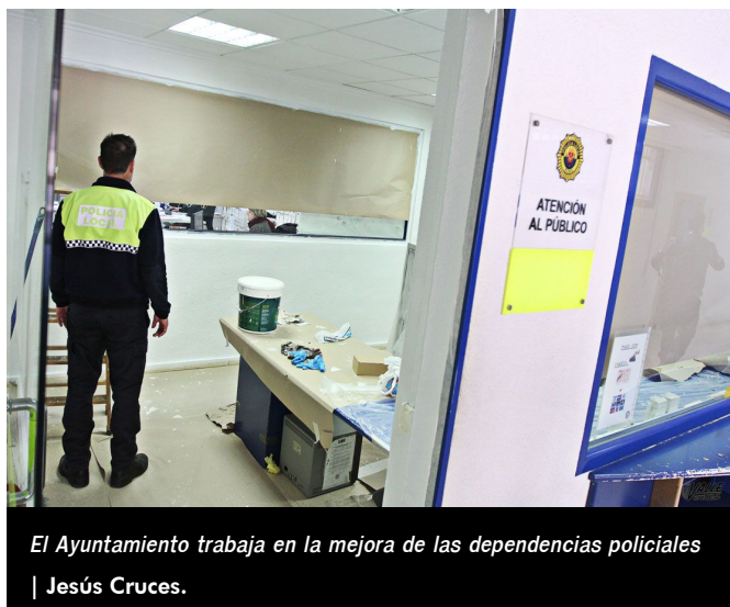
El Ayuntamiento trabaja en la mejora de las dependencias policiales