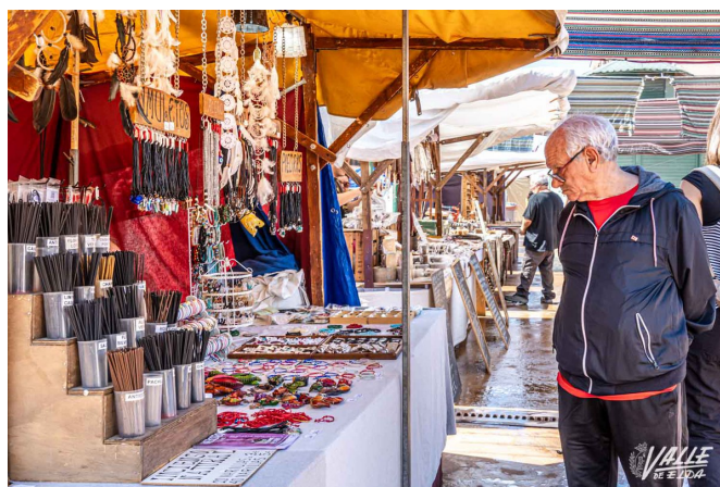
Decenas de puestos venden sus productos durante el fin de semana | Nando Verdú.

La primera jornada tuvo lugar ayer aunque no como se esperaba ya que por la mañana solo abrieron algunos de los puestos debido a la lluvia. A partir de las 18 horas y ante la previsión favorable del tiempo el desarrollo del mercado pudo llevarse con normalidad hasta su cierre.