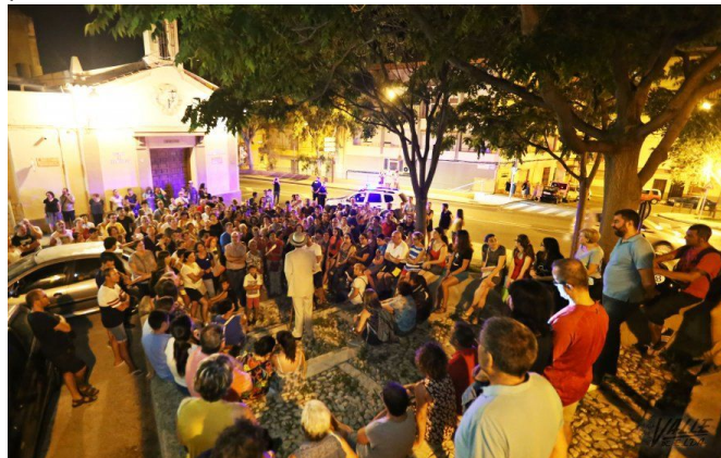
Una de las últimas paradas fue frente a la ermita de San Antón | Jesús Cruces.

En total, 20 las personas participaron en la representación entre actores, músicos y bailarines bajo la dirección de Antonio Santos . La idea de este grupo de actores era sorprender al público aunando teatro, música y la propia historia de la localidad y lo consiguieron con creces, prueba de ello es que el público despidió con un cálido aplauso a los actores . Esta representación volverá a repetirse el próximo martes 25 de julio, a las 22 horas y partirá de nuevo desde la plaza San Pascual.