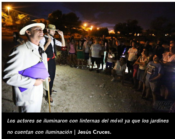
Los actores se iluminaron con linternas del móvil ya que los jardines no cuentan con iluminación