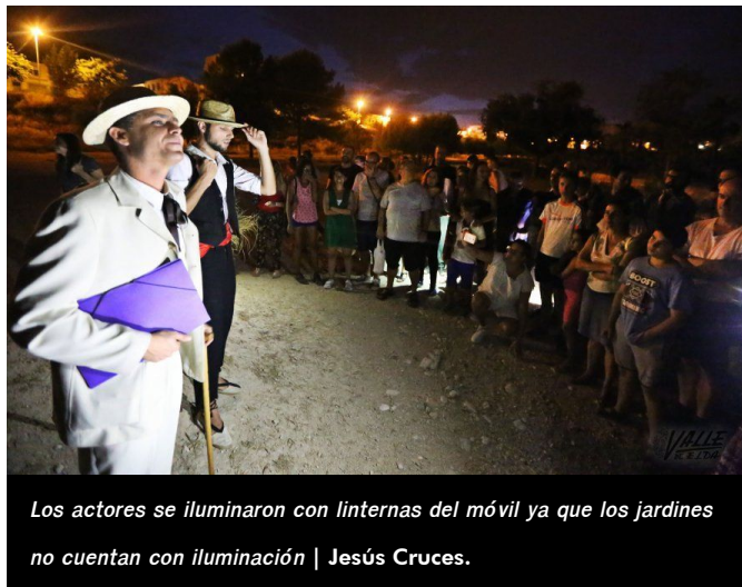
Los actores se iluminaron con linternas del móvil ya que los jardines no cuentan con iluminación | Jesús Cruces.

Estación y de Monóvar, que se derruyeron en varias ocasiones a causa de la crecida del río tras fuertes lluvias. Cada parada contó con un actor que se metió en el papel de un vecino del pasado, guiados por un actor que interpretó a Antonio Sempere, quien fue profesor en 1932 de las Escuelas Nacionales (hoy el colegio público Padre Manjón). Tras el recorrido se invitó a los presentes a tomar la tradicional mistela y unas pastas ya de vuelta en la plaza San Pascual, donde comenzó la actividad.