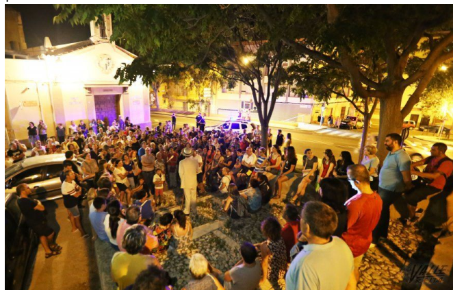
Una de las últimas paradas fue frente a la ermita de San Antón | Jesús Cruces.

En total, 20 las personas participaron en la representación entre actores, músicos y bailarines bajo la dirección de Antonio Santos. La idea de este grupo de actores era sorprender al público aunando teatro, música y la propia historia de la localidad y lo consiguieron con creces, prueba de ello es que el público despidió con un cálido aplauso a los actores. Esta representación volverá a repetirse el próximo martes 25 de julio, a las 22 horas y partirá de nuevo desde la plaza San Pascual.