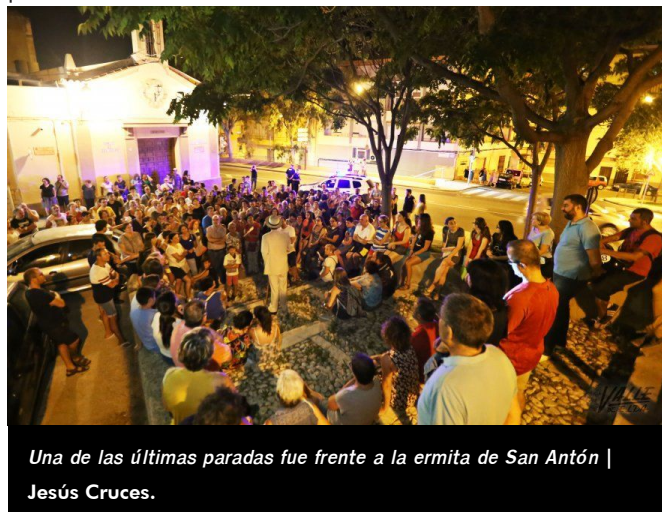
Una de las últimas paradas fue frente a la ermita de San Antón | Jesús Cruces.

En total, 20 las personas participaron en la representación entre actores, músicos y bailarines bajo la dirección de Antonio Santos . La idea de este grupo de actores era sorprender al público aunando teatro, música y la propia historia de la localidad y lo consiguieron con creces, prueba de ello es que el público despidió con un cálido aplauso a los actores . Esta representación volverá a repetirse el próximo martes 25 de julio, a las 22 horas y partirá de nuevo desde la plaza San Pascual.