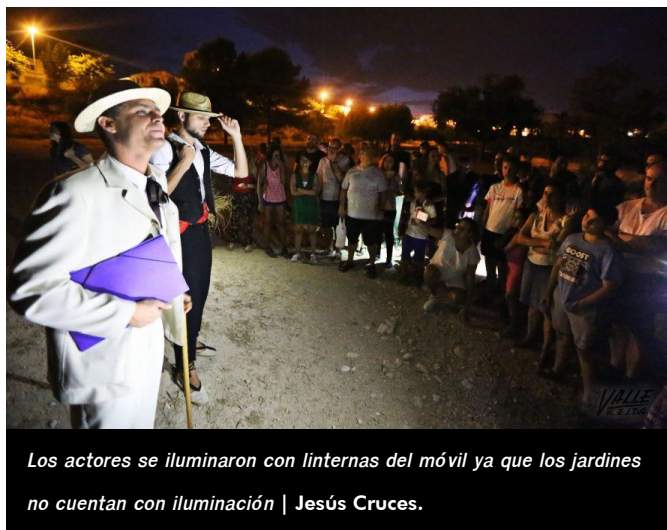
Los actores se iluminaron con linternas del móvil ya que los jardines no cuentan con iluminación