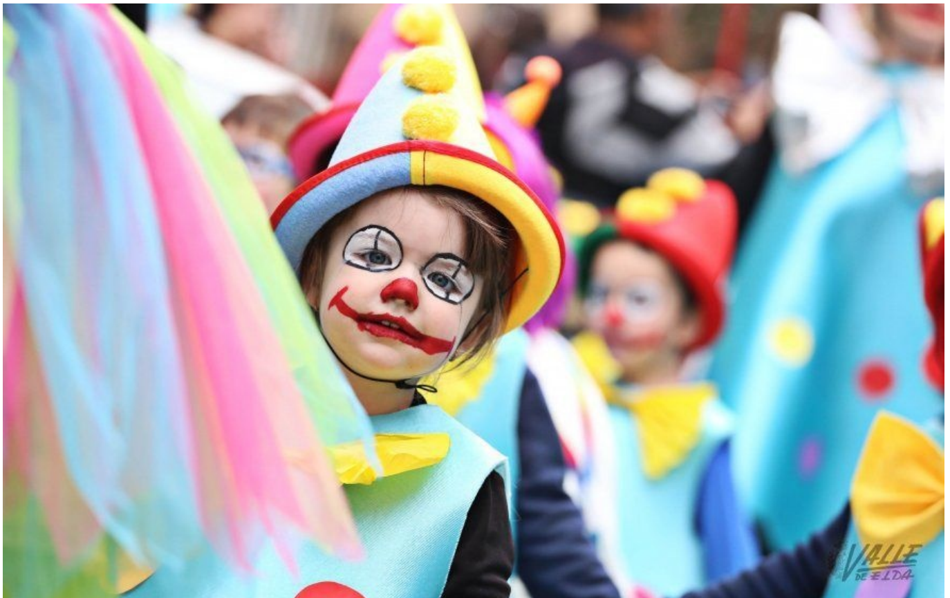
Una de pequeñas de Miguel Hernández, disfrazada de payasa | Jesús Cruces.

Disfrazados de magos, superhéroes, personajes de Star Wars o bailarines , entre otros, miles de niños en Elda y Petrer celebraron ayer el Carnaval contagiando de alegría a los espectadores y a sus familias. Un gran número de colegios iniciaron ayer esta festividad que concluirá el próximo viernes. Ante la emocionada mirada de sus padres y abuelos, los pequeños pudieron disfrutar de este día realizando los tradicionales desfiles junto con actividades y una merienda en sus colegios.