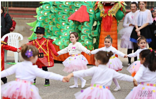
En Nuevo Almagrá los pequeños bailaron las melodías de Tchaikovski | Jesús Cruces.

Un año más cientos de padres, abuelos, y familiares se acercaron a las calles del barrio Nueva Fraternidad para ver el único desfile que se realiza en Elda por las calles de la ciudad , el del colegio Miguel Hernández . Los alumnos desfilaron junto a sus padres y profesores disfrazados de mimos, bailarines, payasos o jefes de pista , pues la temática escogida este año fue El circo.