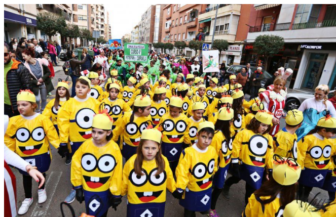
Rambla dels Molins recreó dibujos animados de reconocidas películas infantiles | Jesús Cruces.

Tanto desde las directivas de los centros como desde las AMPAS un año más se han esforzado para que los niños disfruten al máximo de este día tan especial. Las imágenes pertenecen a la celebración de los centros Nuevo Almagrá, Miguel Hernández, Rambla dels Molins y Santo Negro.