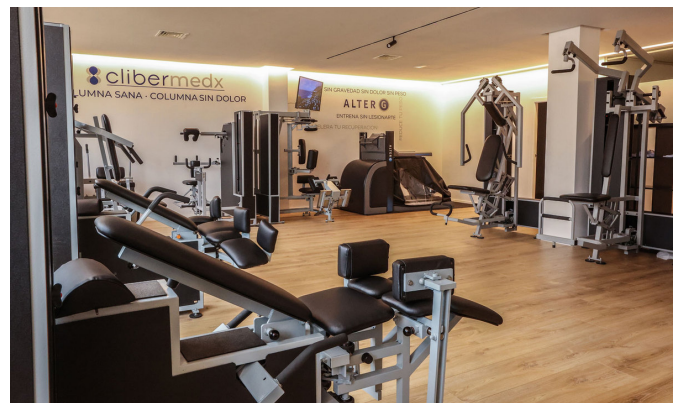
Los pacientes encontrarán las mejores instalaciones para tratar sus dolencias.

Se encuentran en la calle Fray Luis de Granda, 28-30 de Elda. Su web es www.clibersalud.com y su teléfono es el 966 981 564.