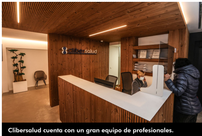
Clibersalud cuenta con un gran equipo de profesionales.

Bernabeu, quienes han optado por implementar su trabajo para mejorar resultados.