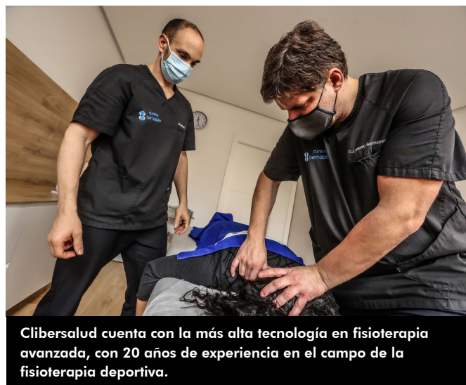
Clibersalud cuenta con la más alta tecnología en fisioterapia avanzada, con 20 años de experiencia en el campo de la fisioterapia deportiva.