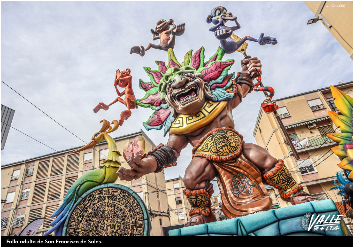
Falla adulta de San Francisco de Sales.

Las críticas y el color han vuelto a los barrios de Elda gracias a las fallas que ya lucen perfectas en los nueve distritos mientras reciben la visita de la población durante el fin de semana. Con sus sagaces críticas y perspicaces ninots estas obras de arte recogen temas de pura actualidad con numerosas referencias a noticias locales. Dos temas han sido, sin duda, los más repetidos, el ascenso a Segunda División del CD Eldense y la colocación de maceteros en el Salón de Actos municipal, lo que ha obligado a trasladar el acto de la entrega de premios a las fallas. En cuanto a los temas generales, se repite la subida general de precios, el Orgullo LGTBQ+ y la reducción del apoyo a la cultura por parte de algunos gobiernos. Por otro lado, destaca que gran