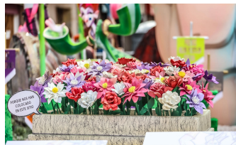
Artificialis spes VALLE DE ALDA 2024 ARTISTA Pascual Saborido