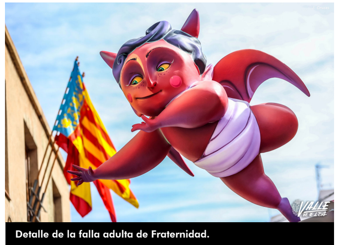
Detalle de la falla adulta de Fraternidad.