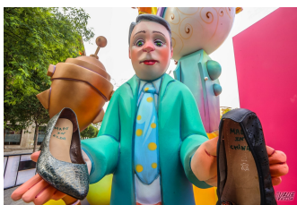
Esta canción me ERIZA la piel... Yo tengo los PÍLOS como todos...