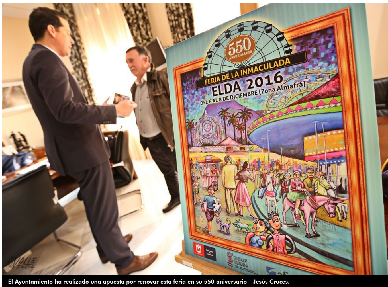
El Ayuntamiento ha realizado una apuesta por renovar esta feria en su 550 aniversario | Jesús Cruces.

La Feria de la Inmaculada brillará este año con luz propia gracias al lavado de imagen que le ha dado el Ayuntamiento de Elda para conmemorar su 550 aniversario. Por ello se instalará una llamativa iluminación de luces led y se realizarán múltiples actividades como desfiles de dinosaurios, una carpa municipal con actividades continuadas gratuitas, la recreación de sus primeros años de la mano del grupo de Teatro Carasses o un correfoc infantil. El equipo de gobierno confía en repetir estas actividades de cara al próximo año.