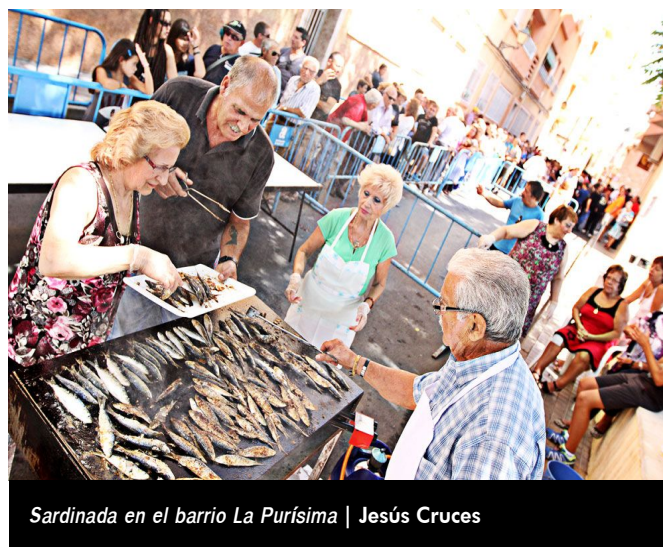
Sardinada en el barrio La Purísima | Jesús Cruces

Esta noche concluirán los actos oficiales de las Fiestas Mayores tras la procesión en honor al Cristo del Buen Suceso, que tendrá lugar tras la Salve que será a las 19:30 horas.