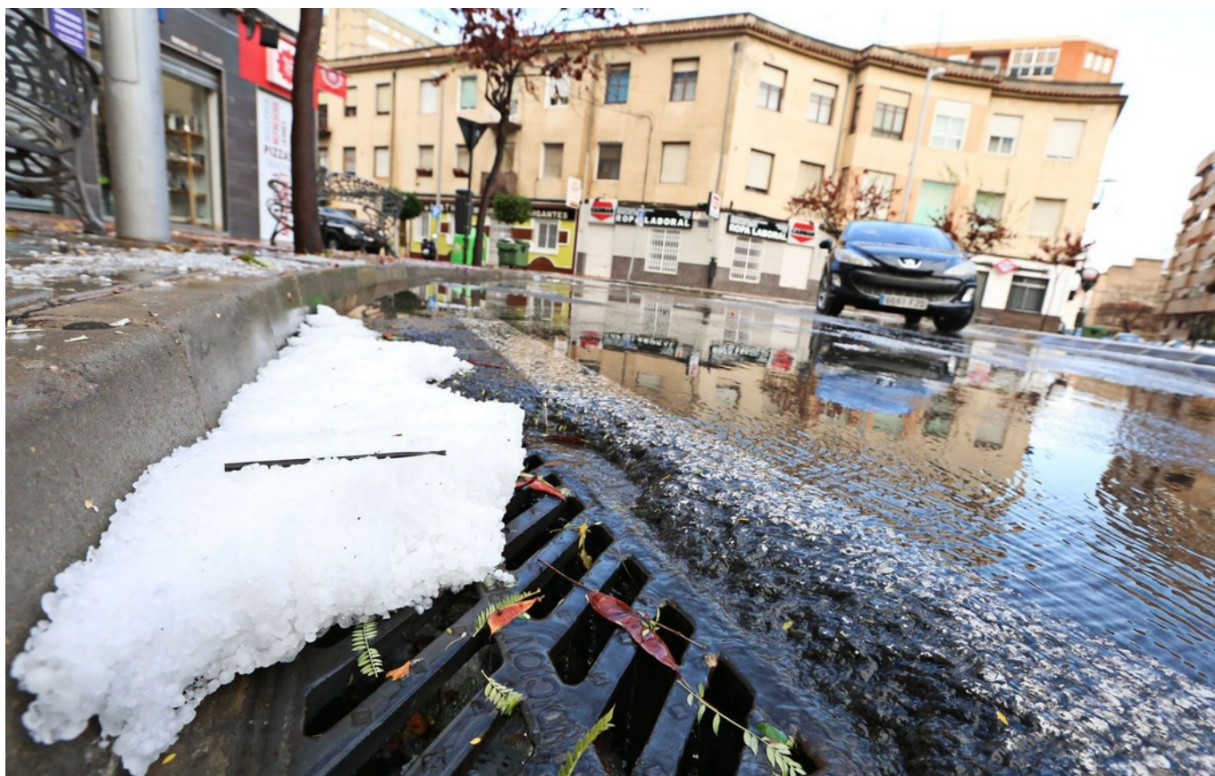
La cantidad de granizo ha caído de forma abundante | Jesús Cruces.

Una tromba de agua, muy intensa y con granizo, ha caído en torno a las 17 horas en Elda y Petrer, sorprendiendo a los vecinos, que han visto cómo en apenas cinco minutos sus balcones y las calles se tornaban de color blanco . Una imagen insólita a la que el valle no está acostumbrado. La fuerte tormenta ha provocado al menos dos accidentes en Petrer, además un rayo ha caído en la Sierra del Caballo, pero la misma lluvia lo ha apagado.