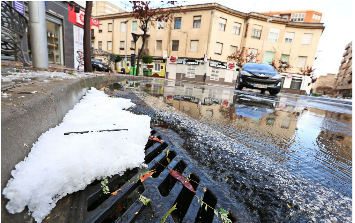
La cantidad de granizo ha caído de forma abundante | Jesús Cruces.

Una tromba de agua, muy intensa y con granizo, ha caído en torno a las 17 horas en Elda y Petrer, sorprendiendo a los vecinos, que han visto cómo en apenas cinco minutos sus balcones y las calles se tornaban de color blanco . Una imagen insólita a la que el valle no está acostumbrado. La fuerte tormenta ha provocado al menos dos accidentes en Petrer, además un rayo ha caído en la Sierra del Caballo, pero la misma lluvia lo ha apagado.