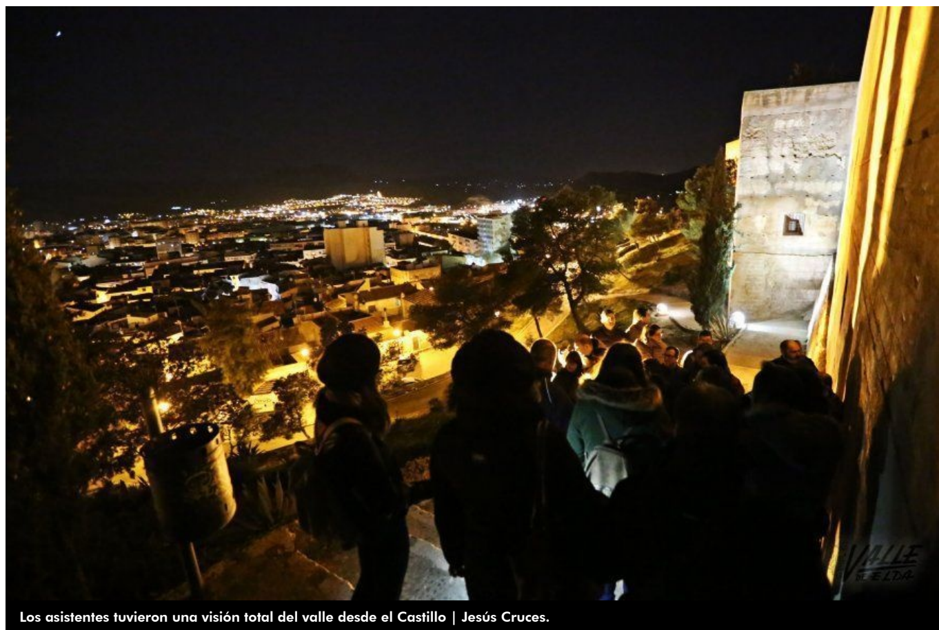
Los asistentes tuvieron una visión total del valle desde el Castillo | Jesús Cruces.

La actividad "Petrer se viste de luna" se ha convertido en un referente turístico y cultural en la comarca, pues después seis años ha conseguido consolidarse gracias al apoyo del público. Se estima que han disfrutado de esta visita nocturna por el casco antiguo de la localidad unas 9.000 personas a lo largo de estos años . Y aunque la mayoría de espectadores son de Petrer y Elda, muchas personas se acercan a conocer Petrer desde todas las localidades de la comarca como Sax, Novelda o Villena, entre otras. Anoche unas 120 personas pudieron disfrutar de esta visita cultural guiada .