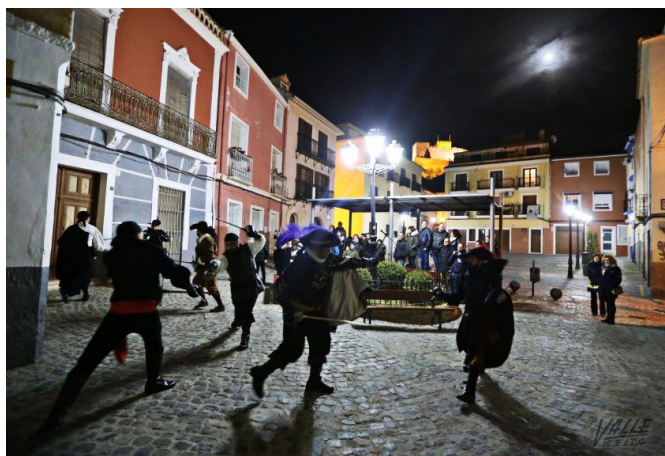
La Asociación Sala de Armas de Elda participó por primera vez en esta actividad

Cada visita es diferente, pues la interacción con el público es esencial . Uno de los cuatro pases de ayer contó con la asistencia de un grupo de Asprodis, que disfrutó y aplaudió cada actuación y arrancó las sonrisas de los actores por su desparpajo.