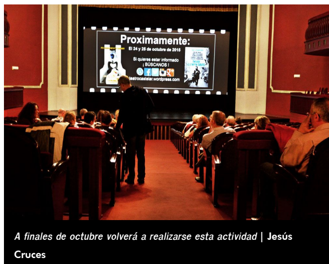
A finales de octubre volverá a realizarse esta actividad

El Teatro Castelar ha anunciado nuevas sesiones de "Momentos de cine" para los días 24 y 25 de octubre, cuando los vecinos podrán ver las películas Los pingüinos de Madagascar y A propósito de Llewyn Davis .