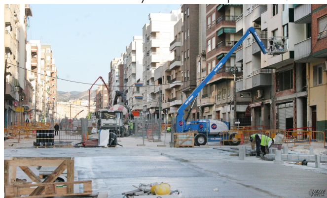
Las reformas comenzaron en 2005 pero no se inauguró hasta tres años después.

convencía que lo gestionara una asociación. Pero al final no encontraron a nadie y nos dieron el préstamo".