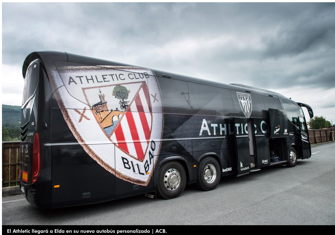
El Athletic llegará a Elda en su nuevo autobús personalizado | ACB.

Mientras en Elda los aficionados buscan debajo de las piedras una entrada para el histórico partido de Copa Eldense-Athletic del 5 de enero (21 horas) el conjunto bilbaíno tiene perfilado el desplazamiento a Elda. En ese sentido, la expedición rojiblanca viaja el mismo día (10:30 horas) en un vuelo chárter desde el aeropuerto de Sondika con dirección a Alicante para alojarse a las 12:15 horas en el hotel alicantino NH.