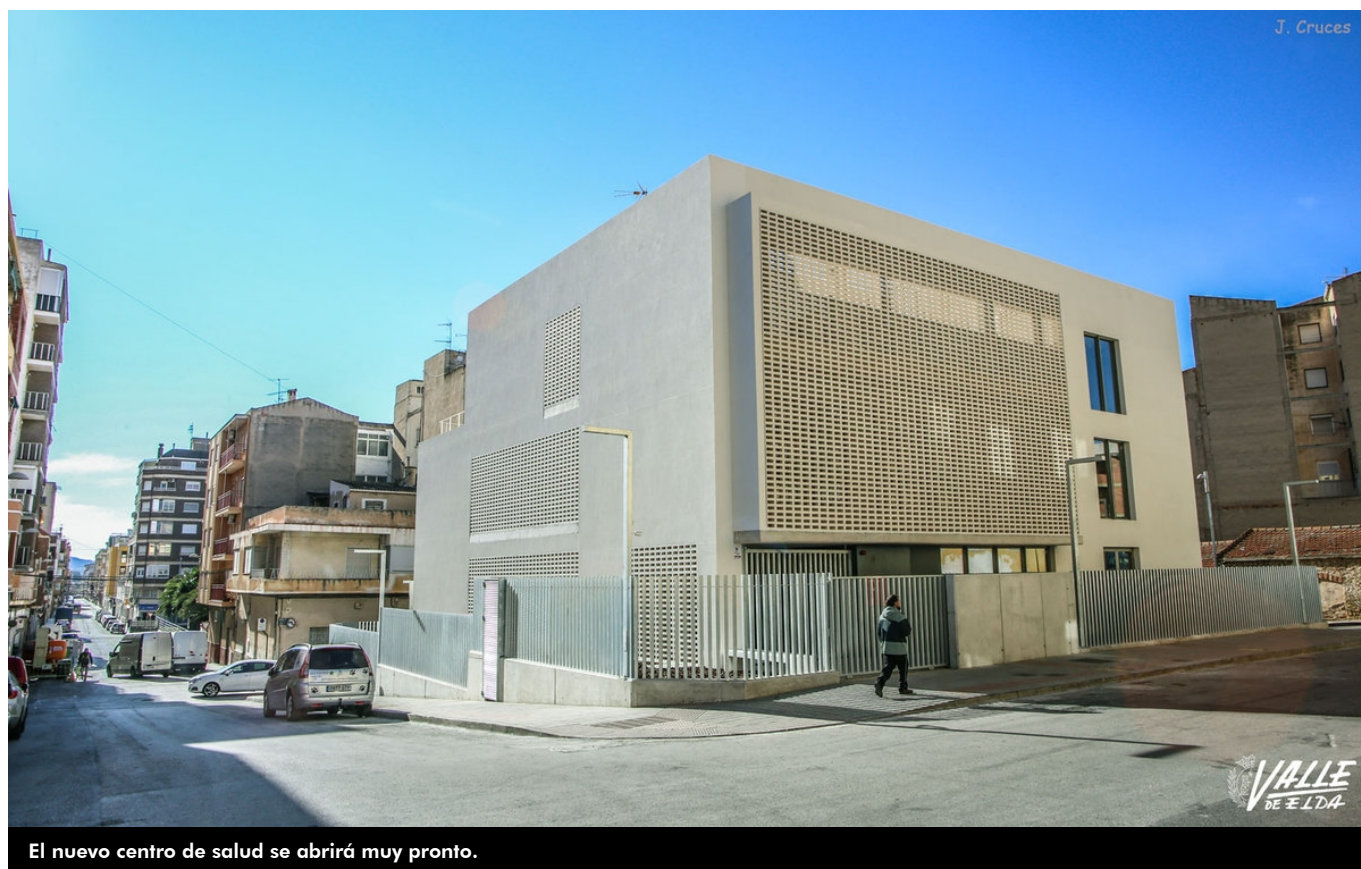
El nuevo centro de salud se abrirá muy pronto.

Con la creación del nuevo centro sanitario auxiliar de Virgen de la Cabeza , Sanidad ha tenido que reordenar a la población con el fin de que acudan al centro de salud más cercano a su domicilio y se redistribuya el número de usuarios entre todos los existentes. A este nuevo espacio acudirán 7.000 personas.