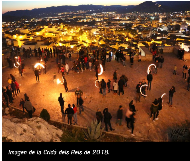
Imagen de la Cridà dels Reis de 2018.

la primera vez que realiza una actividad fuera del casco antiguo y ha tenido una gran acogida, su objetivo es "promocionar todas las costumbres de la villa, que Kaskaruja se expanda por toda la localidad, y que todo el mundo participe en las tradiciones sin importar si vive cerca del Mercado La Frontera o del Castillo, salir del Petrer profundo" , bromea.