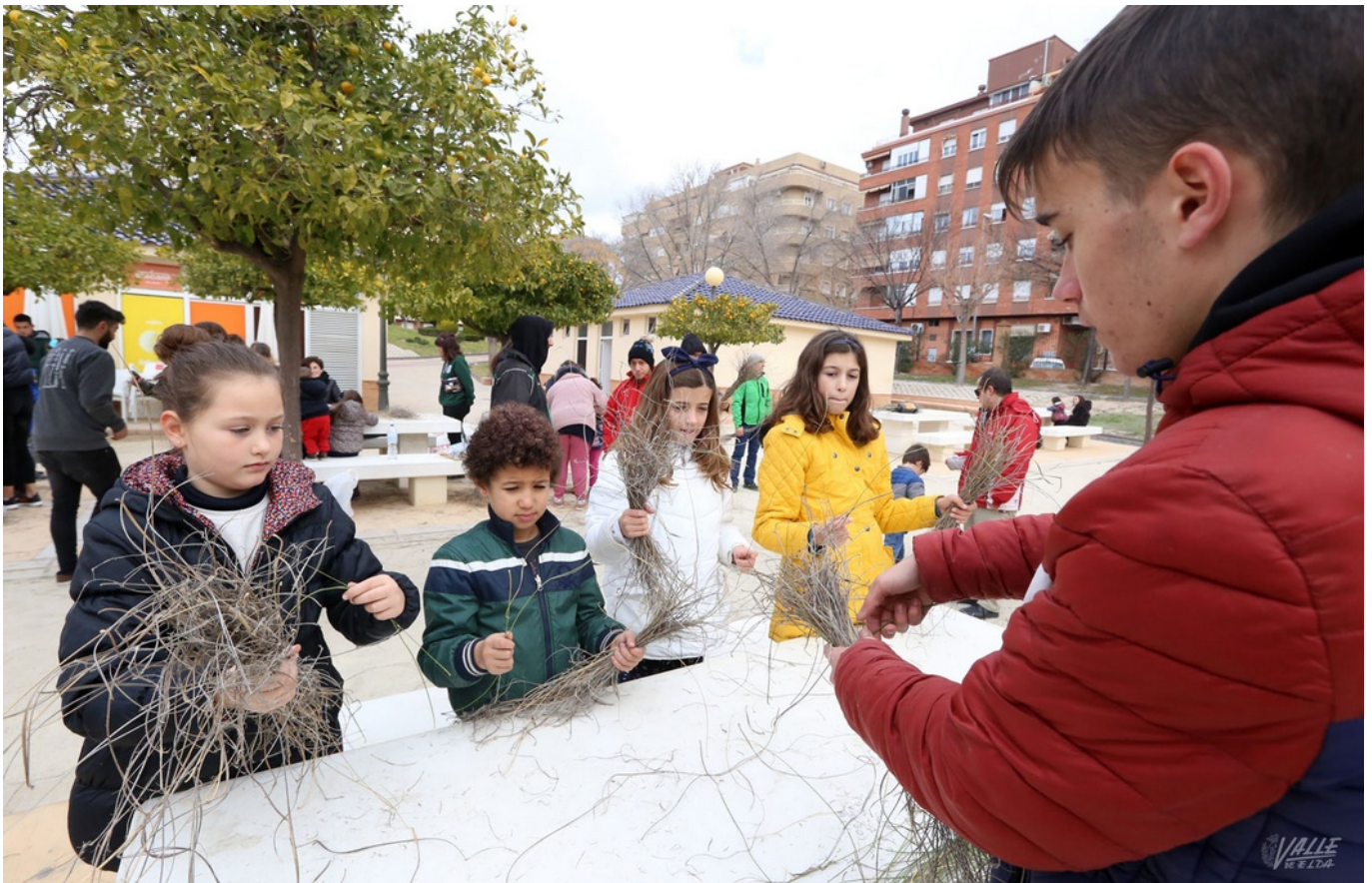
Decenas de niños han preparado hoy su falla en El Campet | Jesús Cruces.

Con el crepúsculo y la llegada de la noche, cada 5 de enero los petrerenses comienzan a rodar sus fallas de esparto para llamar a sus Majestades de Oriente. Un año más, el próximo sábado los Reyes Magos llegarán a Petrer siguiendo el camino del fuego y el humo de las fallas que rodarán cientos de vecinos en la villa. Para tener el máximo número posible, la asociación cultural Kaskaruja ha realizado esta mañana un taller en El Campet en el que han participado decenas de niños. Los más pequeños han preparado con esmero e ilusión su falla para el sábado. Esta actividad ha supuesto todo un éxito, pues el esparto se ha agotado en 45 minutos.