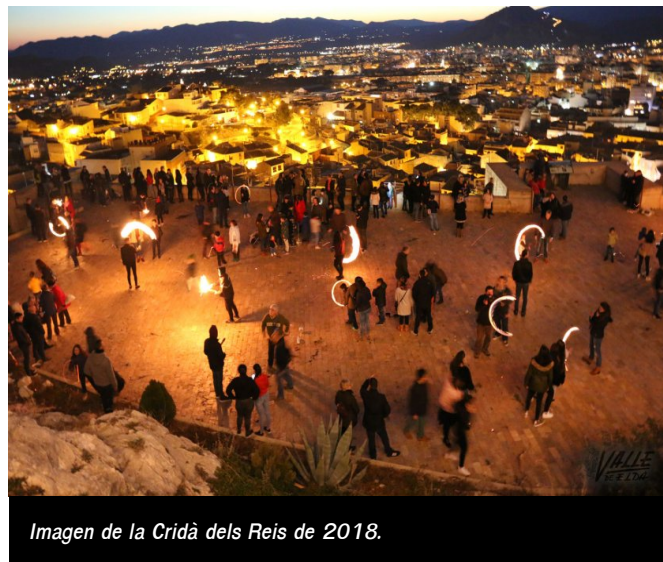
Imagen de la Cridà dels Reis de 2018.

la primera vez que realiza una actividad fuera del casco antiguo y ha tenido una gran acogida, su objetivo es "promocionar todas las costumbres de la villa, que Kaskaruja se expanda por toda la localidad, y que todo el mundo participe en las tradiciones sin importar si vive cerca del Mercado La Frontera o del Castillo, salir del Petrer profundo" , bromea.