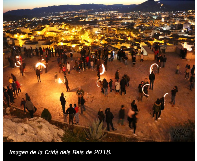
Imagen de la Cridà dels Reis de 2018.

la primera vez que realiza una actividad fuera del casco antiguo y ha tenido una gran acogida, su objetivo es "promocionar todas las costumbres de la villa, que Kaskaruja se expanda por toda la localidad, y que todo el mundo participe en las tradiciones sin importar si vive cerca del Mercado La Frontera o del Castillo, salir del Petrer profundo" , bromea.