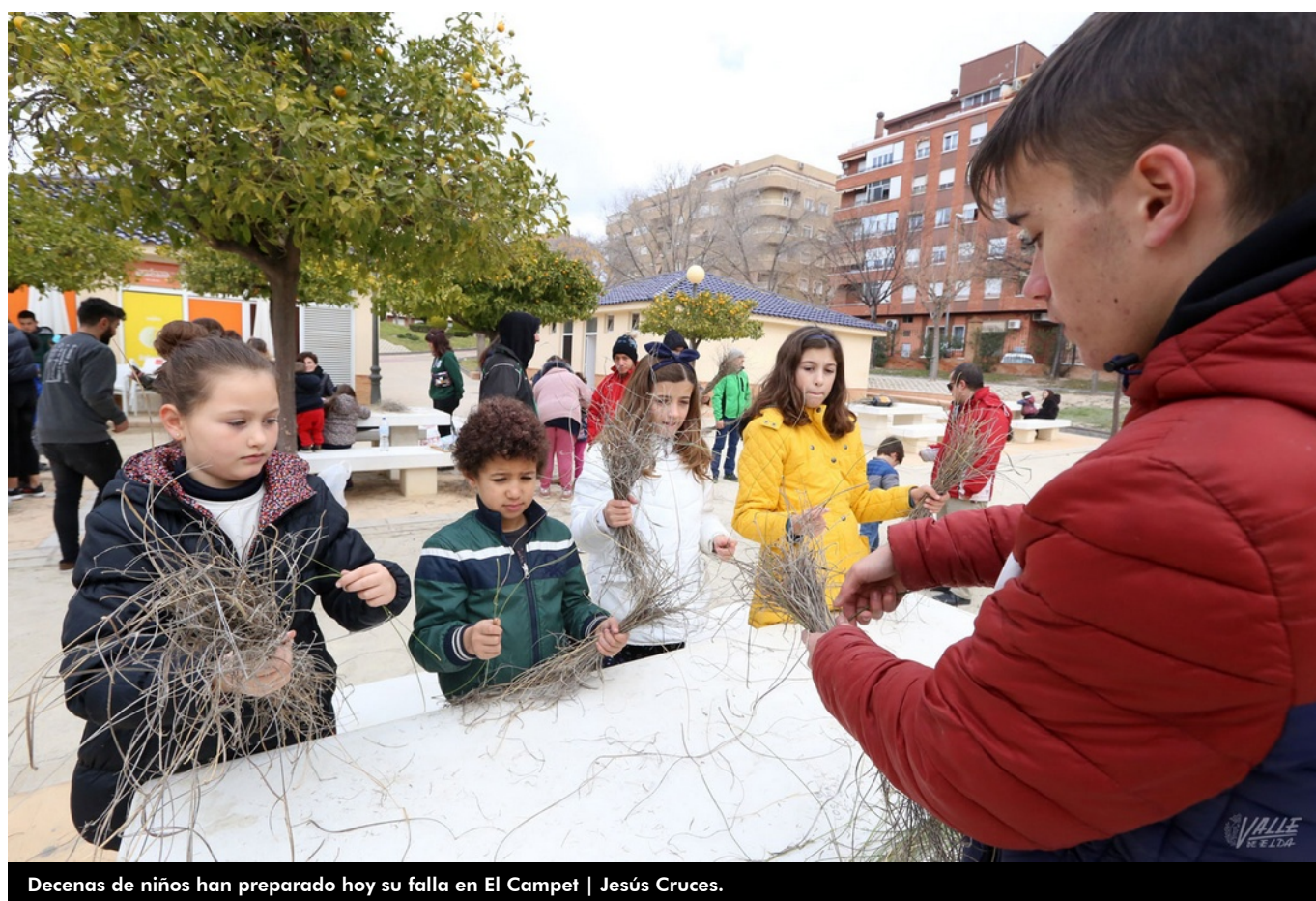
Decenas de niños han preparado hoy su falla en El Campet | Jesús Cruces.

Con el crepúsculo y la llegada de la noche, cada 5 de enero los petrerenses comienzan a rodar sus fallas de esparto para llamar a sus Majestades de Oriente. Un año más, el próximo sábado los Reyes Magos llegarán a Petrer siguiendo el camino del fuego y el humo de las fallas que rodarán cientos de vecinos en la villa. Para tener el máximo número posible, la asociación cultural Kaskaruja ha realizado esta mañana un taller en El Campet en el que han participado decenas de niños. Los más pequeños han preparado con esmero e ilusión su falla para el sábado. Esta actividad ha supuesto todo un éxito, pues el esparto se ha agotado en 45 minutos.