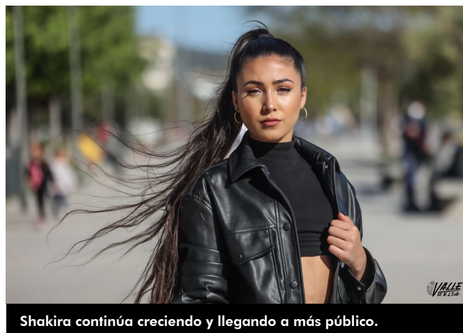
Shakira continúa creciendo y llegando a más público.