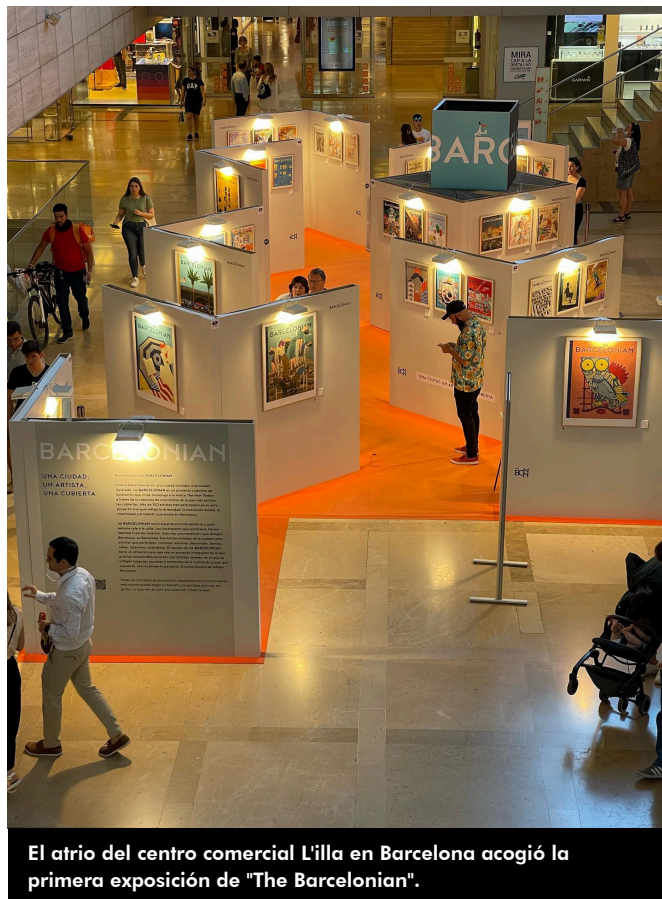
El atrio del centro comercial L'illa en Barcelona acogió la primera exposición de "The Barcelonian".

Hay uno que sale en septiembre que está enfocado en niños pequeños, y consiste en una historia de una niña y un lápiz que se lanzan a una aventura y todo transcurre en una sola línea. Los niños tienen que ir buscando las cosas que hay escondidas, pero sin levantar el lápiz. Otro de los proyectos que estoy terminando es con mi amigo y artista neoyorkino Spencer Finch, que consiste en diseñar los techos de las paradas de una línea de autobús de Washington.