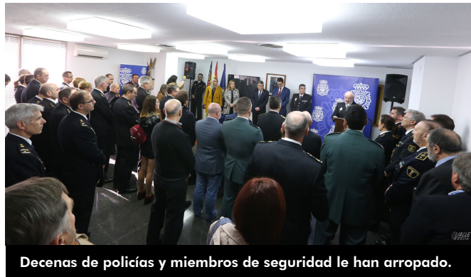
Decenas de policías y miembros de seguridad le han arropado.

coordinación entre fuerzas y cuerpos de seguridad del Estado , atender por igual tanto Elda como Petrer, proteger a todas las personas poniendo especial atención en las más vulnerables. El acto ha concluido con el himno de la Policía Nacional, Tesón de hierro .