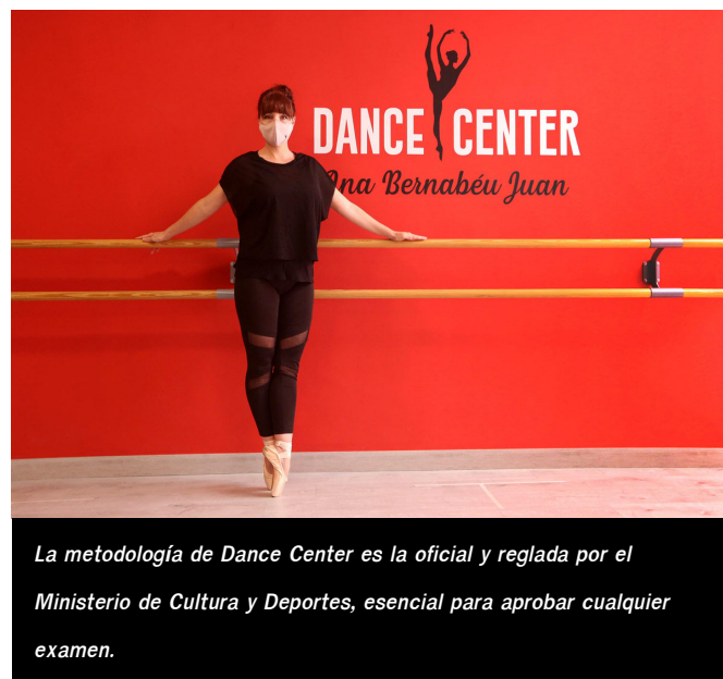
La metodología de Dance Center es la oficial y reglada por el Ministerio de Cultura y Deportes, esencial para aprobar cualquier examen.

Este centro de danza se encuentra en la calle Menéndez Pelayo 21, entresuelo derecha, de Elda. Para más información se puede llamar o enviar un whatsapp al 654 721 481. También puede contactar con Dance Center a través de facebook e instagram .