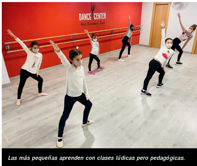
Las más pequeñas aprenden con clases lúdicas pero pedagógicas.

consejos de nutrición y vida saludable para mejorar en todos los sentidos. Es esencial ser constante para ver cómo las metas se van cumpliendo además de conseguir recargar energía, desconectar y disfrutar de una inyección de positividad.