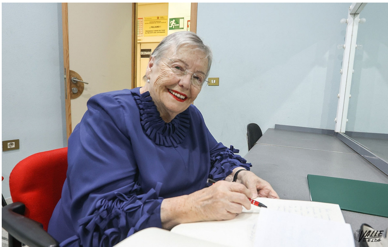
La actriz, conocida por ser la abuela de la serie "Cuéntame", firmó en el libro de honor del teatro