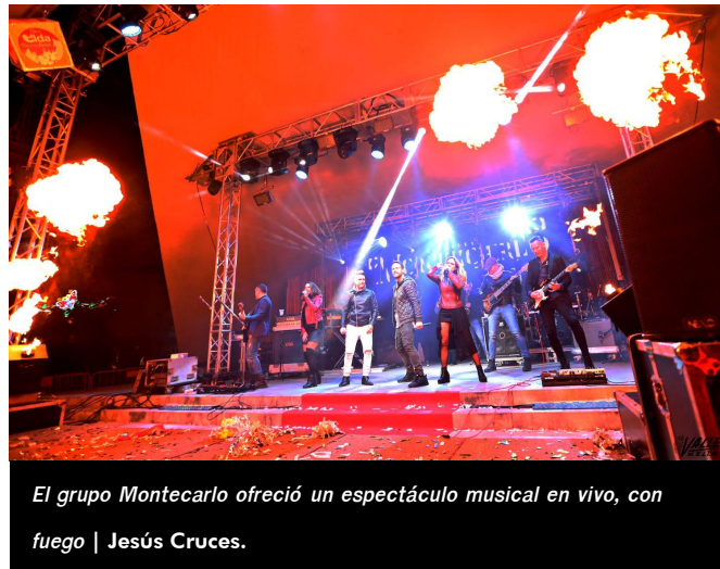
El grupo Montecarlo ofreció un espectáculo musical en vivo, con fuego | Jesús Cruces.

de 11 a 13 horas el Embajador Real estará en la puerta principal del Mercado Central para recoger las últimas cartas y a las 18 horas, será la Bajada de las Antorchas desde el monte Bolón, que anunciará a los pequeños la llegada de sus Majestades. La Cabalgata comenzará a las 19 horas por el itinerario habitual, que finalizará en la Plaza del Ayuntamiento con el acto de Adoración. Pero antes, el Teatro Castelar acogerá el Concierto Especial Reyes 2018 a cargo de la Orquesta Sinfónica del Teatro Castelar, a las 20 horas.