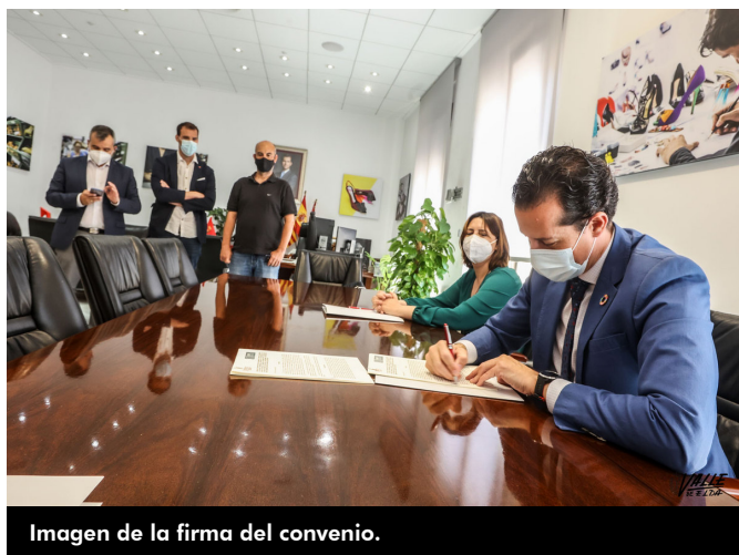
Imagen de la firma del convenio.

comprometidos con sus ideales. Fueron derrotados pero no vencidos y se tuvieron que marchar del país, la mayoría acabaron en Mauthausen, 19 fallecieron y 14 fueron liberados, pero marcados de por vida. Aunque sabemos de su historia, todavía queda mucho por investigar”.