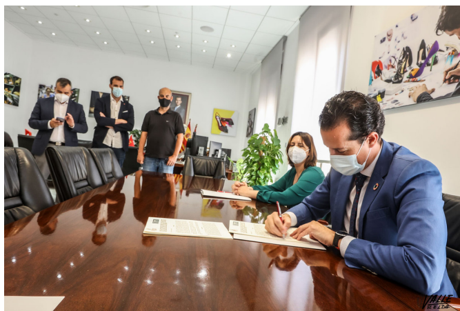
Imagen de la firma del convenio.

comprometidos con sus ideales. Fueron derrotados pero no vencidos y se tuvieron que marchar del país, la mayoría acabaron en Mauthausen, 19 fallecieron y 14 fueron liberados, pero marcados de por vida. Aunque sabemos de su historia, todavía queda mucho por investigar”.