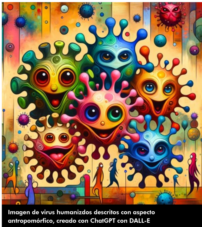
Imagen de virus humanizados descritos con aspecto antropomórfico, creado con ChatGPT con DALL-E

A diferencia de la mayoría de los virus que tienen ADN como material genético, los retrovirus tienen ARN. Este ARN es de cadena simple y contiene toda la información genética necesaria para la replicación del virus. Los retrovirus llevan una enzima llamada transcriptasa inversa. Esta enzima es crucial porque permite la conversión del ARN viral en ADN. Este proceso es lo que hace únicos a los retrovirus. Una vez que el ARN del retrovirus se convierte en ADN, este ADN se integra en el genoma de la célula huésped. Esta integración es realizada por otra enzima llamada integrasa. Una vez integrado, el ADN viral puede ser replicado junto con el ADN de la célula huésped cada vez que la célula se divide. Debido a su capacidad de integrarse en el genoma del huésped, algunos retrovirus pueden permanecer latentes dentro de las células durante largos periodos. Esto puede hacer que el tratamiento de las enfermedades que causan sea particularmente difícil. El ejemplo más conocido de un retrovirus es el Virus de la Inmunodeficiencia Humana (VIH), que causa el Síndrome de Inmunodeficiencia Adquirida (SIDA). Otro ejemplo es el Virus Linfotrópico de Células T Humanas (HTLV), asociado con ciertos tipos de leucemias y linfomas. Los retrovirus no solo afectan a sus huéspedes a través de enfermedades, sino que también han tenido un impacto significativo en la evolución.