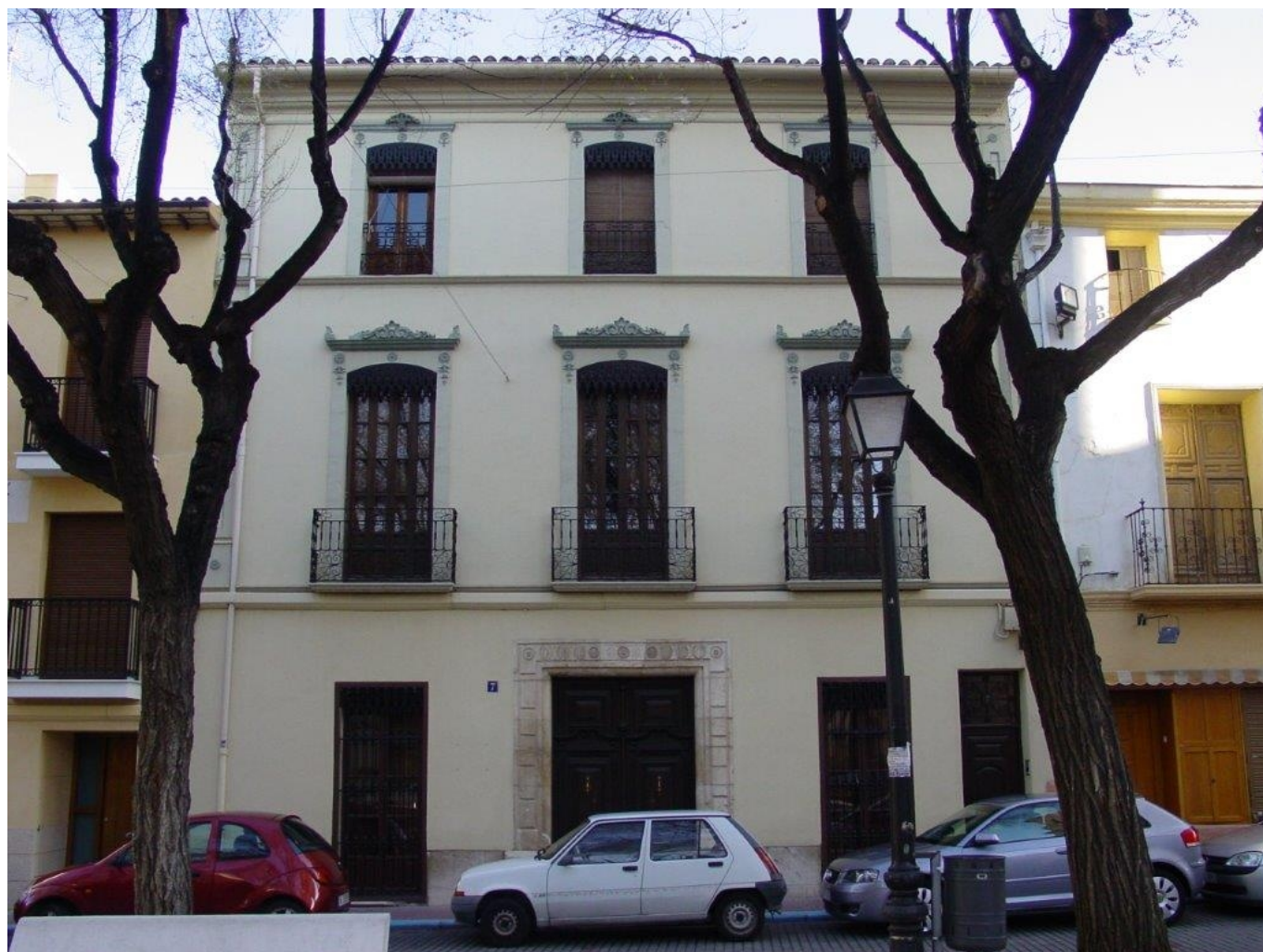
La casa del mayorazgo protagonista de la novela "El enfermo" | Rubén Navarro.

Petrer ha contado a lo largo de la historia con casas que han lucido en sus fachadas sus emblemas o escudos demostrando de este modo su hidalguía y su poderío.