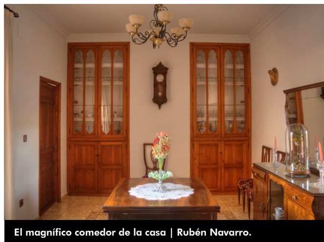
El magnífico comedor de la casa | Rubén Navarro.

La casa se compone de planta baja y dos alturas, que originalmente guardaron la jerarquía propia de la época: planta baja que albergaba cocina, comedor y otras dependencias, donde se desarrollaba la vida cotidiana; la planta principal o planta noble, donde se ubicaban las dependencias privadas de la familia; y la última planta o “cambra”, utilizada para conservar alimentos, para la cría de animales (conejos, gallinas...) y otros menesteres similares. La casa cuenta con una pequeña bodega subterránea donde se almacenaban tinajas con vino y aceite. En la parte posterior de la casa se hallaba un huerto que llegaba a la actual calle La Huerta y que desapareció en la primera mitad del siglo XX para dar paso a una edificación industrial.